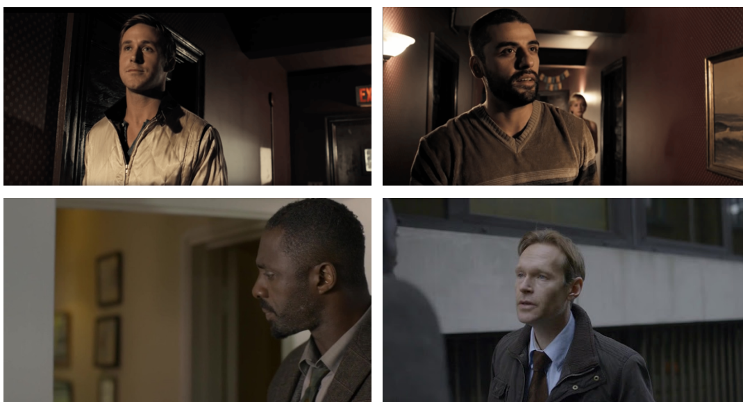
Slika 8: Vizualni predlošci dekomponiranih kadrova, isječci iz filma „Drive“ i televizijske serije „Luther“