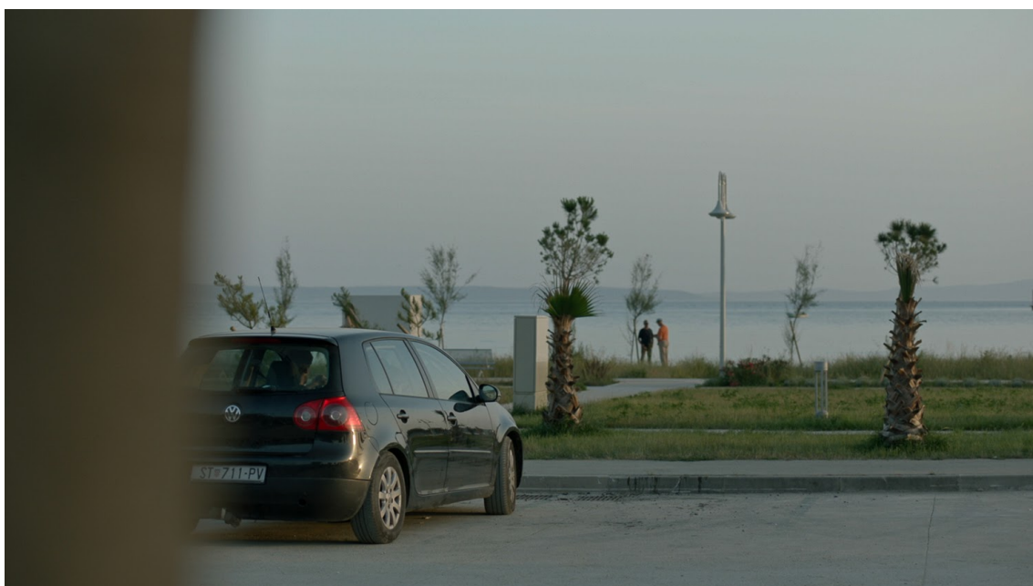
Slika 5: Usporedba lokacije parkirališta, isječak iz filma