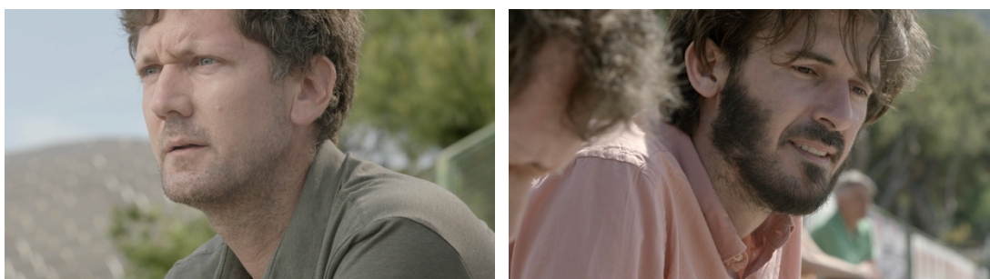
Slika 22: Isječci iz kratkometražnog filma „Mali Libero“

Ako se ne bavimo dalje tim pitanjima, ostaje nam trenutna verzija obrade slike. Uočavam mjesta u filmu u kojima na snimanju, ali ni u postprodukciji nisam uspjela održati kontinuitet. Za primjer ću uzeti scenu s nogometnih tribina, konkretno krupne kadrove očeva - Boška i Luke.