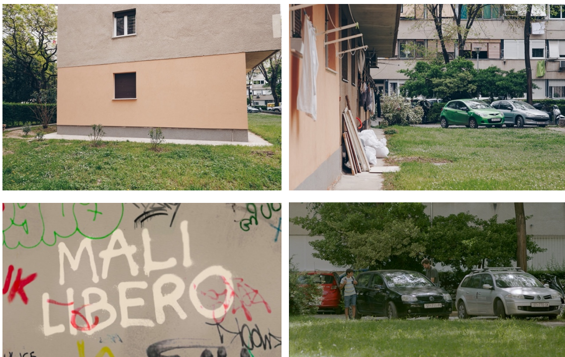
Slika 1: Usporedba lokacije parkirališta, isječak iz filma

Parkiralište zgrade smo tražili imajući na umu željeno otvaranje filma. Ideja je bila da sporijom vožnjom preko čiste fasade zgrade otvorimo pogled na parkiralište u trenutku u kojem Boško zaustavlja auto, te on i Petar izlaze iz istoga. Čista fasada bila nam je bitna kako bi se u postprodukciji omogućilo dodavanje naslova filma.