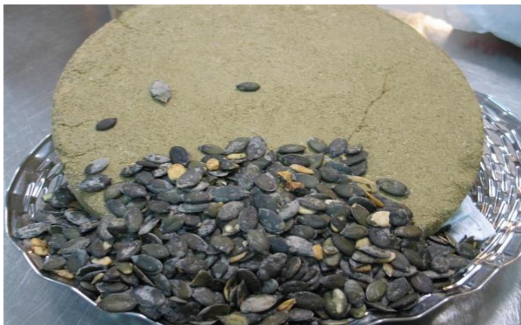
Slika 3. Bučine sjemenke i pogača (Brkan, 2013).

uče je zaštićena ljuskom. Ovisno od strukture i udjela celuloze u ljusci, postoje dvije vrste koštice: sa ljuskom i bez ljuske (golica). Kod koštice golice umjesto čvrste, bijele celulozne ljuske na jezgru prijanja tanka opna tamnozeleno boje. Oba tipa koštice koriste se u proizvodnji ulja, međutim golica je pogodnija jer daje veći prinos ulja i pogaču bolje kvalitete. Isto tako obje vrste imaju visok prinos svježeg ploda i suhog zrna, a sadržaj ulja u jezgri golice se kreće od 45 do 49%.