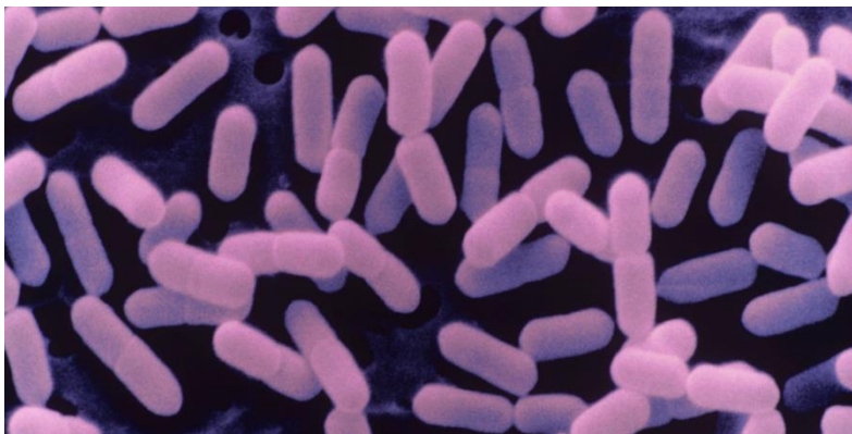
Slika 1. Listeria monocytogenes

L. monocytogenes je štapićasta, fakultativno anaerobna bakterija. Pripada skupini gram pozitivnih bakterija (Slika 1). To su mikroaerofilne bakterije koje rastu u uvjetima smanjene koncentracije kisika. Ne proizvode spore, mogu se razmnožavati unutar velikog raspona pH (4,3 – 9,6) i temperature (1 – 45 °C). Uspijeva u supstratima od blago kiselih do alkalnih pH vrijednosti, ali ne i u vrlo kiselom okruženju. Opseg vrijednosti pH u okviru kojih se može razvijati ovisi o supstratu i temperaturi.