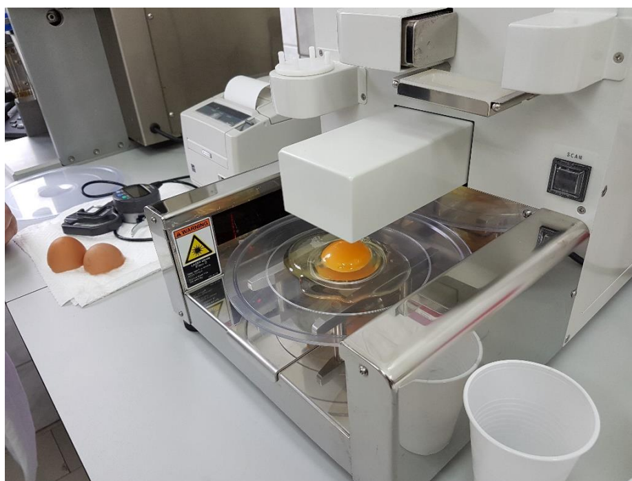
Slika 4.5.4.1. Određivanje boje žumanjka, visine bjelanjka i Haugh jedinica

Za određivanje boje žumanjka, visine bjelanjka i Haugh jedinica korišten je automatski analitički uređaj NABEL - Digital Egg Tester DET-6000 (Slika 4.5.4.1.). Mjerenju je pristupljeno neposredno nakon razbijanja ljuske te mjerenja njezine čvrstoće i debljine. Uređaj posjeduje posebnu prozirnú površinu na koju se izlije žumanjak zajedno s bjelanjkom. Uređaj pomoću lasera skenira žumanjak i bjelanjak te se nakon nekoliko sekundi na ekranu pojavi vrijednost boje žumanjka i Haugh jedinica i visine bjelanjka.