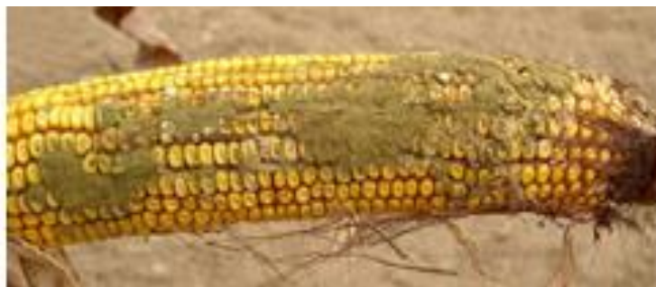
Slika 2.1.3.1. Prikaz Aspergillosa klipa kukuruza

Plijesni iz roda Aspergillus proširene su po cijelom svijetu, ali najčešće se nalaze u krajevima sa toplim klimatskim uvjetima. Visoke temperature okoliša (iznad 25 °C) te suše dovode do stanja stresa kod Aspergillus flavus-a zbog čega u tim uvjetima proizvodi aflatoksine (Bankole i Adebajo 2003.). Aflatoksini, od svih mikotoksina, najbolje su proučeni te je otkriveno da imaju kancerogen učinak na ljude i životinje. Kukuruz i ostale žitarice sadrže, uglavnom više različitih mikotoksina, koje patološki djeluju na organizam životinja (Rupić 2009.).