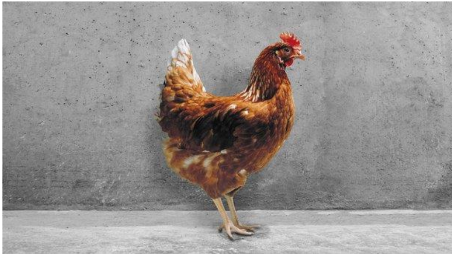
Slika 2.5.3.1. Prikaz Hisex brown nesilice

zbrinute i hranjene od perioda valjanja do nesivosti. Postizanjem idealne mase tijela za svaki tjedan života jedini je način da se dobije željeni rast kokoši i razvoj spolnog sustava. Ovaj hibrid tolerantan je na mnoge uvjete, ali najveća nesivost i kvaliteta postižu se kada se kokoš drži u optimalnim uvjetima. Ukoliko ju se smjesti u premali prostor doći će do smanjene proizvodnje jaja, a u slučaju prevelikog prostora dolazi do velike konzumacije hrane, te energetske potrošnje (Haider 2014.).