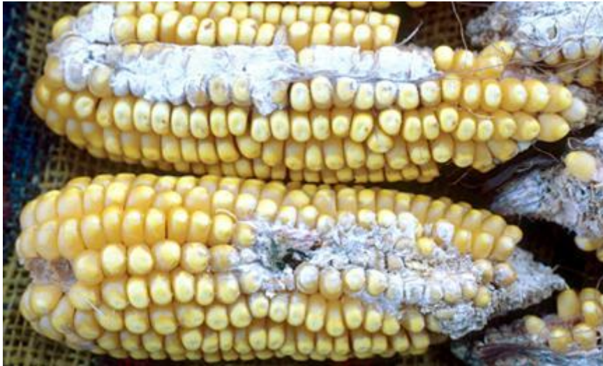
Slika 2.1.1.1. Prikaz klipova kukuruza obraslih gljivicama iz roda Fusarium