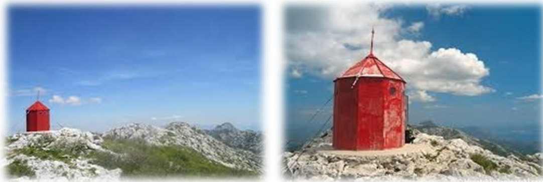
Slika 4.3.3. Planinarsko sklonište Vickov stup Mosor