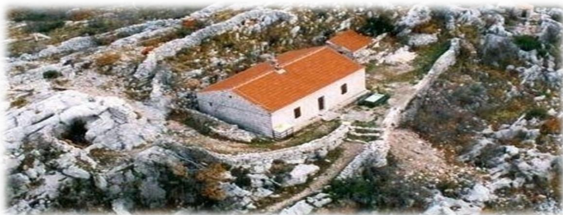
Slika 4.3.2. Planinarska kuća Lugarnica Mosor

Planinarska kuća Lugarnica nalazi se u teško pristupačnom kršu na zapadnom dijelu Mosora, na Užinskoj kosi. Sagrađena je 1903. i služila je kao šumarska lugarnica. Stara lugarnica je 1994. stradala od udara groma, ali je nakon toga obnovljena (Poljak, Ž. 2008.). Kuća sada ima kuhinju sa štednjakom na drva i blagovaonicu, dnevni boravak, sobu sa skupnim ležajem na dvije etaže, pitku vodu i struju (agregat). Planinarska kuća je otvorena svakog vikenda, osim tijekom ljetnih mjeseci. Broj noćenja kapaciteta je 20 kreveta.