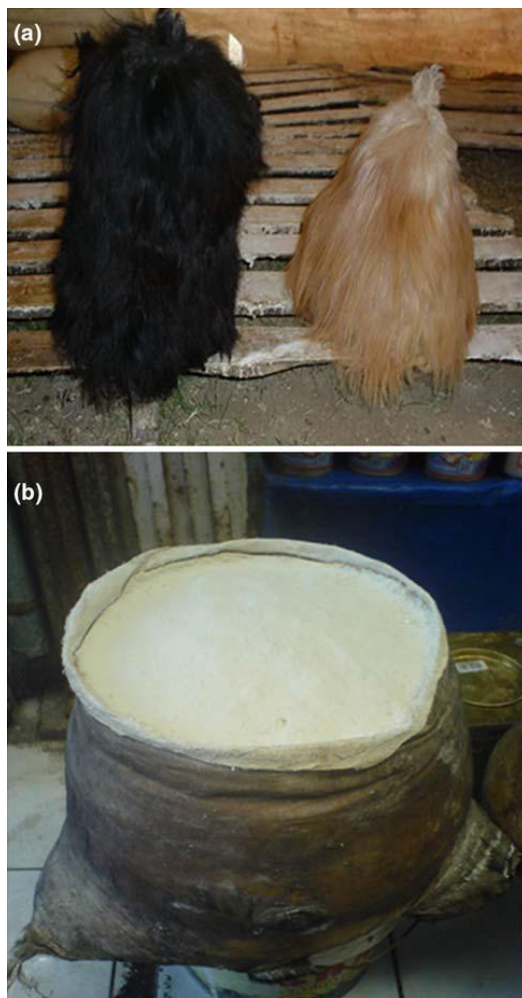
Slika 5.1.1. a) životinjska koža s dlakom prije prodaje sira, b) životinjska koža bez dlake za vrijeme prodaje