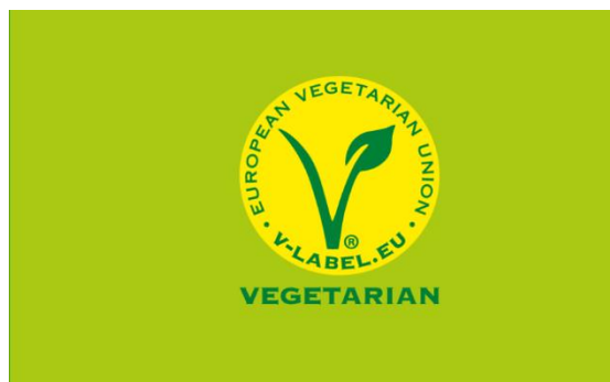
Slika 2.1.1.1.. Europska vegetarijanska oznaka (V-oznaka) za vegetarijance

plant based“). Obje inačice prikazane su na slici 2.1.1.1.. Preporuka je V-oznaku smjestiti na prednju stranu pakiranja proizvoda.