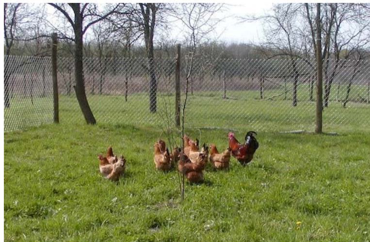
Slika 1.1. Rasplodno jato kokoši hrvaticice na ispustu

Kokoš hrvatica je izvorna hrvatska pasmina kokoši koja je dobro prilagođena takvom sustavu. Kokoš hrvatica je službeno priznata kao pasmina 1998 godine (NN 127/98). Uzgaja se odvojeno u četiri soja: crveni, jarebičasto-zlatni, crni i crno-zlatni soj. Karakteristika ove pasmine su bijeli podušnjaci te kod crvenog i jarebičasto-zlatnog soja bijele noge dok su kod crnog i crno-zlatnog soja noge sivkaste boje. Osim iznimno velike prilagodljivosti na promjenjive okolišne uvjete koji ju čine poželjnom pasminom za alternativni uzgoj, sama činjenica da se radi o izvornoj pasmini te ju smatramo kulturnim blagom Republike Hrvatske daje na važnosti njenom očuvanju te sve češćem korištenju u proizvodnji mesa i jaja.