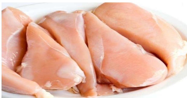
Slika 2.4.3. Pileće meso

Gledajući Sliku 2.4.1. goveđeg mesa, Sliku 2.4.2. svinjskog mesa i Sliku 2.4.3. pilećeg mesa možemo zaključiti da je meso piletine najsvjetlije boje i sadrži najmanji udio masti, u odnosu na goveđe i svinjsko meso.