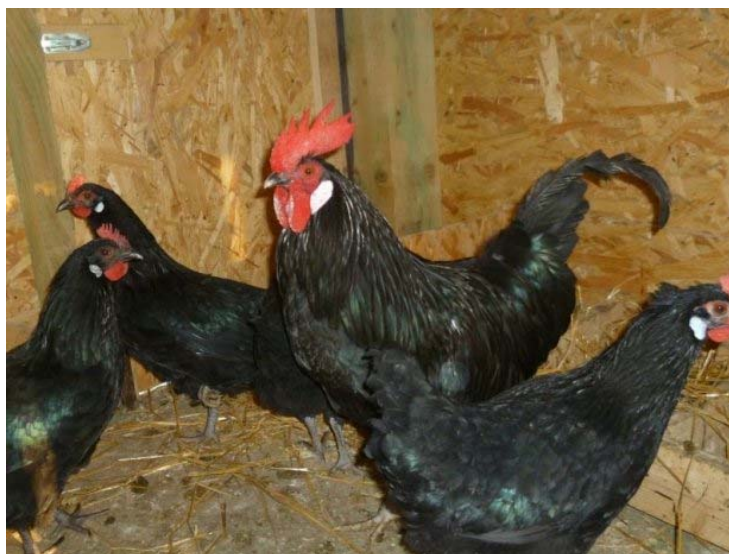
Slika 2.3.3 Crni soj

c) Crni soj (Slika 2.3.3) - potpuno crne boja metanog sjaja, kako kod pijetlova, tako i kod kokoši. Bijeli podušnjaci, noge sivkaste boje.