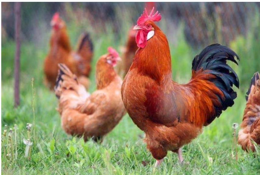
Slika 2.3.1 Crveni soj

a) Crveni soj (Slika 2.3.1)- osnovna boja perja je ciglasto crvena sa narančastozlatnim vratom bez crnog crteža. Također boja može varirati od svijetlociglaste do tamnocrvene. Kod pijetlova rep je crn sa metalno zelenim sjajem, dok je kod kokoši samo vrh repa obojen crno.