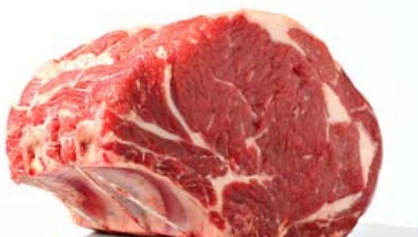
Slika 2.4.1. Goveđe meso

Izuzev što se pileće meso razlikuje po svom kemijskom sastavu i energetske vrijednosti od mesa drugih vrsta, također ima puno razlike i u senzoričkim svojstvima mesa. Razlike se mogu primijetiti na Slici 2.4.1., na kojoj je prikazano meso govedine, na Slici 2.4.2. na kojoj je prikazano meso svinjetine i na Slici 2.4.3. na kojoj je prikazano meso piletine.