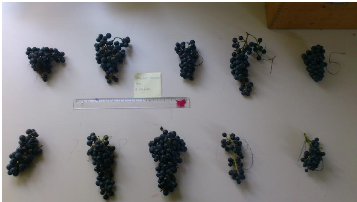
Slika 4. Mjerenje grozdova za uvometrijsku analizu grozda i bobice

Uvometrijska istraživanja se provode u fazi pune zrelosti grožđa. Uzorak ne smije biti manji od 10 grozdova i 100 bobica. Grozdovi moraju biti neoštećeni i uzimaju se na točno propisan način koji osigurava reprezentativnost uzorka.