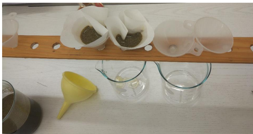
Slika 3.1.1. Filtriranje smjese pokrovnih biljaka

Svježa nadzemna masa pokrovnih biljaka osušena je u sušioniku na 70 °C u trajanju od 72 sata, nakon čega je usitnjena pomoću električnog mlina. Smjesa je pripremljena potapanjem suhe biljne mase u destiliranu vodu u omjeru 100 g suhe biljne mase na 1 litru destilirane vode (1:10). Dobivena smjesa ostavljena je 24 sata na sobnoj temperaturi, nakon čega je filtrirana kroz dvostruki filter papir kako bi se uklonile čestice većih dimenzija (slika 3.1.1.).