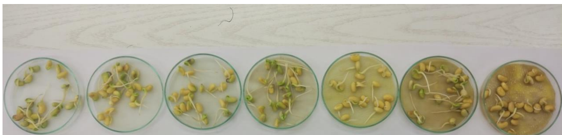
Slika 4.1.1. Utjecaj različitih koncentracija vodenog ekstrakta pokrovnih biljaka na klijavost sjemena soje (s desna na lijevo: 0; 0,5; 1,0; 2,5; 5,0; 7,5; 10 %)

Iz grafikona je vidljivo da ni jedna istraživana koncentracija vodenog ekstrakta pokrovnih biljaka nije utjecala na klijavost u usporedbi s kontrolom. Također, nije dokazana statistički značajna razlika između istraživanih koncentracija. Na kontrolnom tretmanu utvrđena je 100 %-tna klijavost soje, kao i pri koncentracijama od 0,5; 2,5; 5,0 i 7,5 % (Slika 4.1.1.).