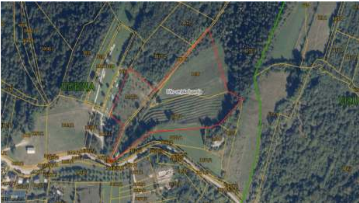
Slika 1 Izvod iz katastarskog plana

Zemljište, koje je u vlasništvu OPG-a Brkić, obuhvaća tri katastarske čestice (3077/1, 3072/3 i 3076) ukupne površine 30.649 m 2 u općini Udbina. Cestovno je dobro povezano, udaljeno je samo 1 km od obiteljske kuće i 18 km od ulaza na autocestu Zagreb-Split. Dobra cestovna povezanost je izrazito bitna kod poljoprivredne proizvodnje zbog bržeg izvoza proizvoda s parcele i bržeg dolaska mehanizacije.