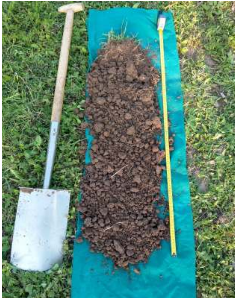
Slika 4 Prikaz strukture tla na dubini 0-90 cm