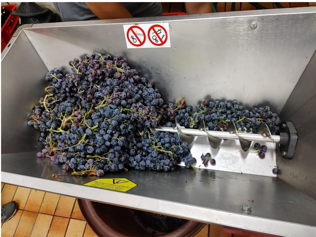
Slika 5. Prikaz runjanja i muljanja grožđa sorte 'Muškat Hamburg'

Vinifikacija je obavljena po standardnom postupku za dobivanje crnih vina. Grožđe je muljano te stavljeno na fermentaciju u inoks-tankove zapremnine 120L opremljenih sustavom za kontrolu temperature gdje je provedena kontrolirana fermentacija. U most je dodan selekcionirani soj kvasca S.cerevisae Uvaferm 228, na temperaturi od 18^{\circ}\text{C} . Nakon 5 dana provedeno je prešanje te je vino nastavilo sa tihom fermentacijom. Nakon završetka fermentacije, vino je sumporeno i pretočeno s taloga. Uzorci su se uzimali u staklene boce te su se analizirali na Zavodu za vinogradarstvo i vinarstvo Agronomskog fakulteta Sveučilišta u Zagrebu.