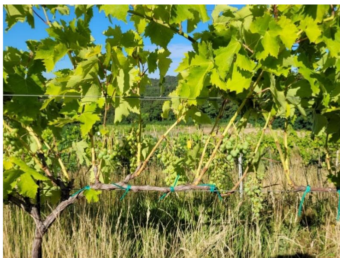
Slika 4. Prikaz defoliranih trsova