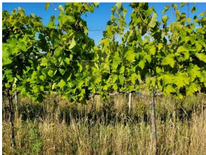
Slika 3. Prikaz kontrolnih trsova

Pokus je postavljen po slučajnom bloknom rasporedu. Blok čini 8 trsova. Pokus je sastavljen od dva tretmana- djelomična defolijacija i kontrola, a svaki tretman ima 3 ponavljanja. Tretman djelomične defolijacije proveden je u fazi zametanja bobica, što odgovara 29. stadiju prema modificiranoj E-L skali (Coombe, 1995). Pokus se sastojao od dvije vrste tretmana: tretman s djelomičnom defolijacijom i tretman bez djelomične defolijacije odnosno kontrola. Djelomična defolijacija obavila se 8. srpnja 2022. Lisna površina izračunata je pomoću metode Lopes i Pinto (2005) za svaku lozu u eksperimentu. U trenutku pune zrelosti su sva ponavljanja zasebno pobrana, dana 31.8.2022. Određeni su elementi rodosti: prinos po trsu, prosječna masa grozda te prosječni broj grozdova po trsu. Sa svakoga trsa u pokusu pobrojani su grozdovi i izvagana njihova ukupna masa iz čega se dobila prosječna masa grozda.