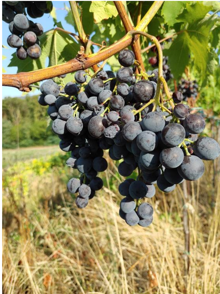
Slika 1. Grozd 'Muškat Hamburga'

osjetljivost na pepelnicu od koje najčešće strada. Ova sorta preferira umjereno plodna, umjereno vlažna, propusna i topla tla. Preporučuje se uzgoj na južno, južno – zapadnoj ekspoziciji. Prema Korenici (1982) važno je voditi brigu o klimatu, ekspoziciji, nadmorskoj visini i potencijalnim zasjenjivanjima terena radi vrlo visoke osjetljivosti ove sorte na niske temperature. Sadržaji šećera variraju od 19,0% pa do 24,0%, dok kiseline od 6,5% do 7,0%.