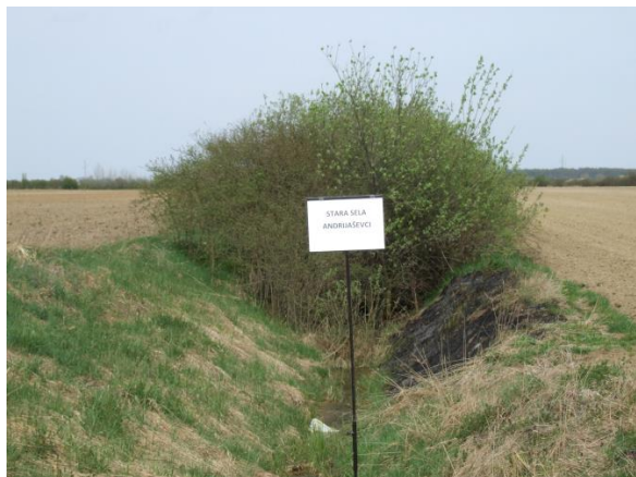
Slika 2. Zarasli melioracijski kanal, Stara Sela, Vukovarsko-srijemska županija (Petošić i sur., 2015)

Osnovni razlog slabljenja funkcije melioracijskih kanala je nekontrolirani rast vegetacije (slika 2 i 3) koji svojom biomasom pogoršavaju stanje kanala, često do razine apsolutne neiskoristivosti.