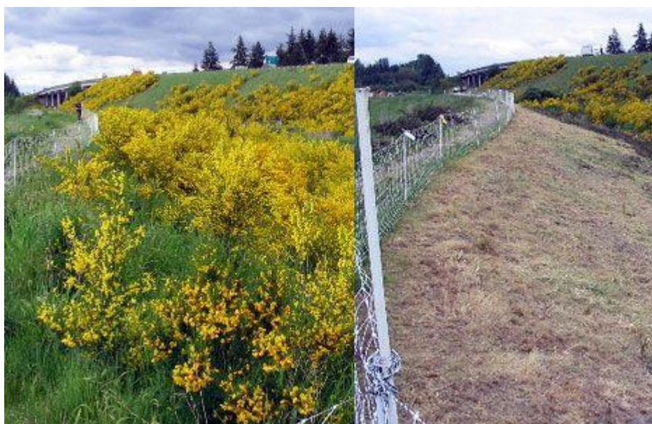
Slika 9. Kanal prije i poslije „mob grazing“ usluge (M.G. Richard, 2009)

Prilagodba koza na brstenje rezultira prehranom bogatijom proteinima, ali manje probavljivosti nego prehrana ovaca (Wilson i sur., 1975). Koze najradije jedu biljne vrste s većim udjelom lista, cvijeta i sjemena, odnosno bjelančevina i topivih ugljikohidrata, a manje stabljike. Sklonost koze prema brstu povezuje se i s većom tolerancijom na razinu tanina u biljkama (Mioč i Pavić, 2002). Maleček i Provenza (1981) su utvrdili da koze vrlo učinkovito iskorištavaju vegetaciju brdsko-planinskih područja na kojima dominiraju različite drvenaste vrste i grmlje, dok godišnji obrok koza čine 60% različite grmolike vrste, 30% trave i 10% zeljanice (Mioč i Pavić, 2002). Zbog takvih kvaliteta sve su popularnije u uslugama čišćenja određenih površina. U praksi se to izvodi tako da se ciljana područja čišćenja vegetacije nekoliko dana opterete velikim brojem koza, tzv. „mob grazing“ (slika 9).