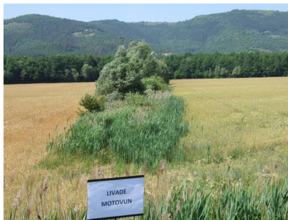
Slika 3. Zarasli melioracijski kanal, Motovun, Istarska županija (Petošić i sur., 2015)