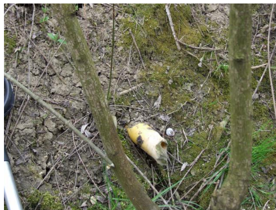
Slika 5. Oštećenje drenske cijevi spaljivanjem vegetacije (Petošić i sur., 2015)