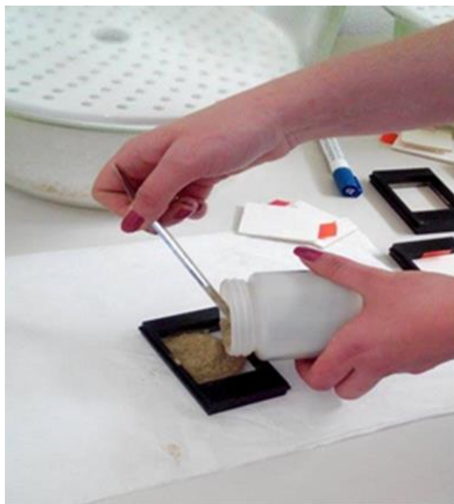
Slika 2. Punjenje kivete uzorkom za skeniranje

Svi uzorci su skenirani na NIRS aparatu (Foss, model 6500; slika 3) pomoću infracrvenog elektromagnetskog spektra, u valnoj duljini 1100 - 2500 nm korištenjem ISI SCAN programa (verzija 1.5 (Infrasoft International, Port Matilda, PA, USA)). Spektrima uzoraka su pridružene odgovarajuće kalibracije. Obzirom na prethodno utvrđenu količinu dostavne ST, procijenjeni su slijedeći parametri hranjivosti: korigirana ST, sirovi proteini (SP), razgradivi SP, neutralna detergent vlakna (NDV), metabolička energija (ME), kiselost (pH), amonijski dušik (NH 3 -N), šećer i probavljivost OT u ST (D-vrijednost). Rezultati istraživanja su obrađeni korištenjem statističkog programa SAS (SAS Institut, 1999) korištenjem GLM procedure.