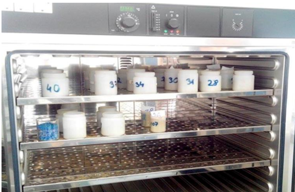
Slika 1. Uzorci za skeniranje u sušioniku

Dostavna vlaga ( \text{g kg}^{-1} svježeg uzorka) je utvrđena sušenjem uzoraka u sušioniku s ventilatorom (tvrtke ELE International) na temperaturi od 60^\circ\text{C} do konstantne mase uzoraka (slika 1). Ovako osušeni uzorci su samljeveni na veličinu čestica od 1 mm korištenjem mlina čekićara tvrtke Christy (Model 11) i dalje korišteni za spektrofotometrijsku analizu.