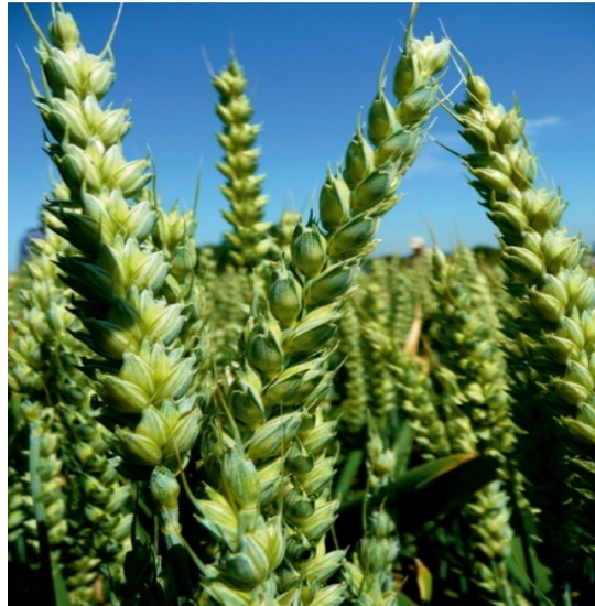
Slika 4.3.3.2. Jara pšenica cv. Lennox