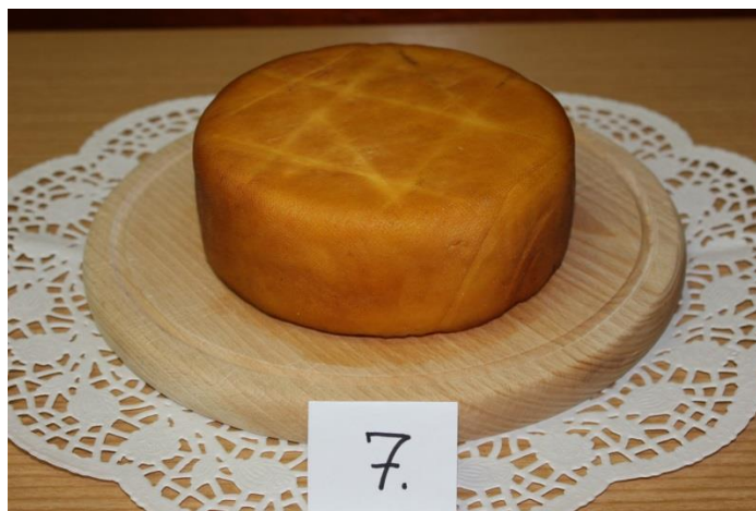
Slika 3. Kuhani sir - dimljeni

Za proizvodnju se koristi punomasno mlijeko (večernje i jutarnje mužnje), koje se procijedi kroz gazu te se zagrijava do vrenja. U tako zagrijano mlijeko, uz miješanje, dodaje se sol (2%), a nakon toga i alkoholni ocat (5%). Slijedi "mirovanje" i formiranje sirnog gruša te se započinje s drugim zagrijavanjem do temperature 88-98°C u trajanju do 20 min, do pojave bistre sirutke zelenkaste boje. Sirni gruš se premješta u pripremljene kalupe, odnosno vlažnu gazu. Slijedi prešanje sira, uz postupno povećavanje tlaka prešanja. Prešanje traje od 3-4 sata, a za to vrijeme okrene se 2-3 puta. S obzirom da postoji varijanta kuhanog sira koja je dimljena, nakon prešanja sir se može dimiti željenom vrstom drva, 3-4 sata (slika 3). Ukoliko nije predviđeno dimljenje sira, konzumacija je moguća neposredno nakon prešanja. Kuhani sir se konzumira u svježem stanju tj. bez zrenja. Ovakav sir, mladi i dimljeni, može se konzumirati unutar 3 mjeseca, ukoliko je pohranjen u hladnjaku pri temperaturi 4-8°C (Havranek, 2003).