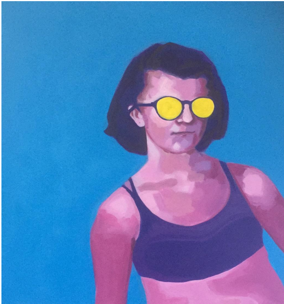
Ana , 2018., kombinirana tehnika