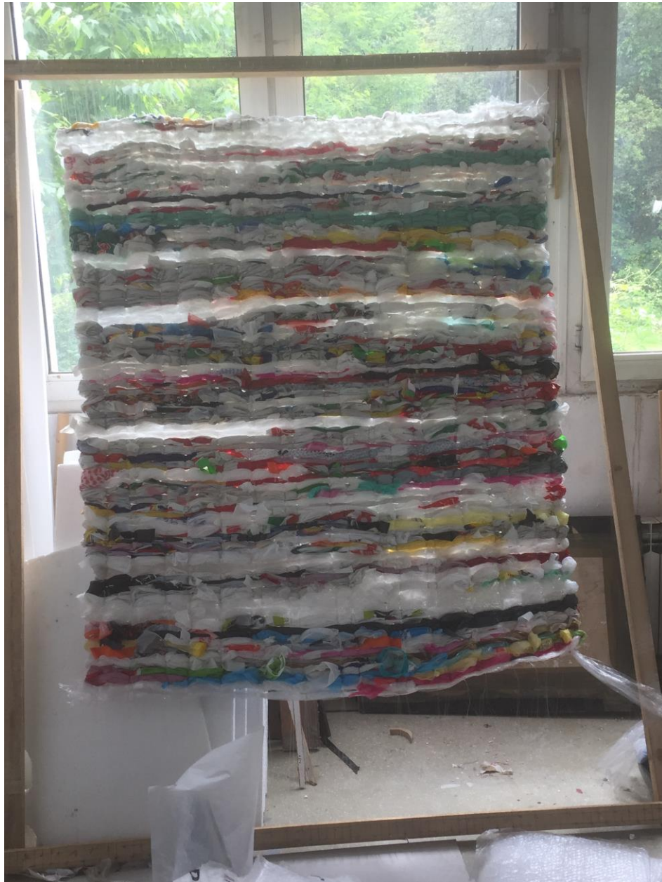
Plastična tkanina, 2019, jednokretna plastika i flaks