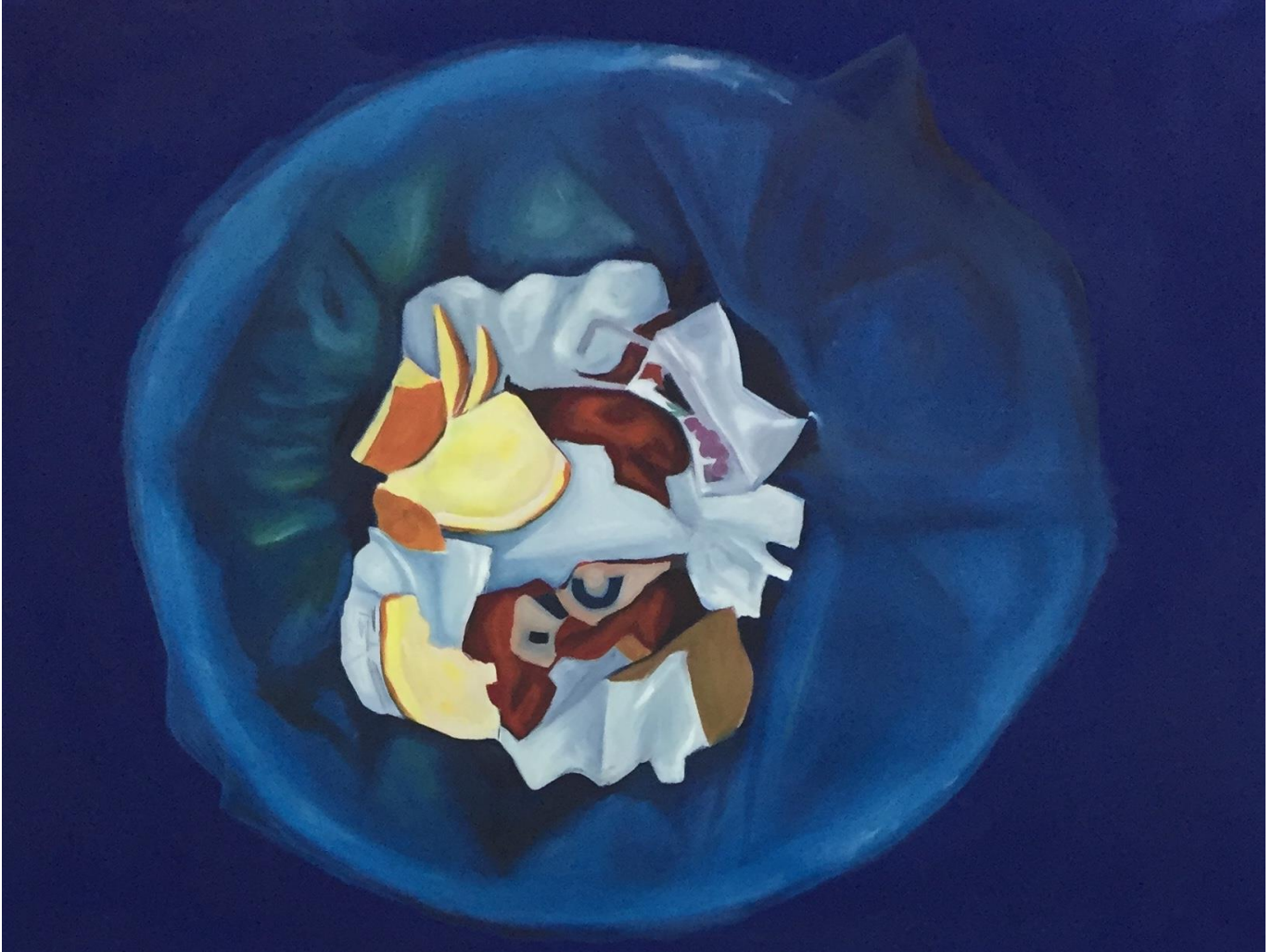
Smeće, 2018., kombinirana tehnika