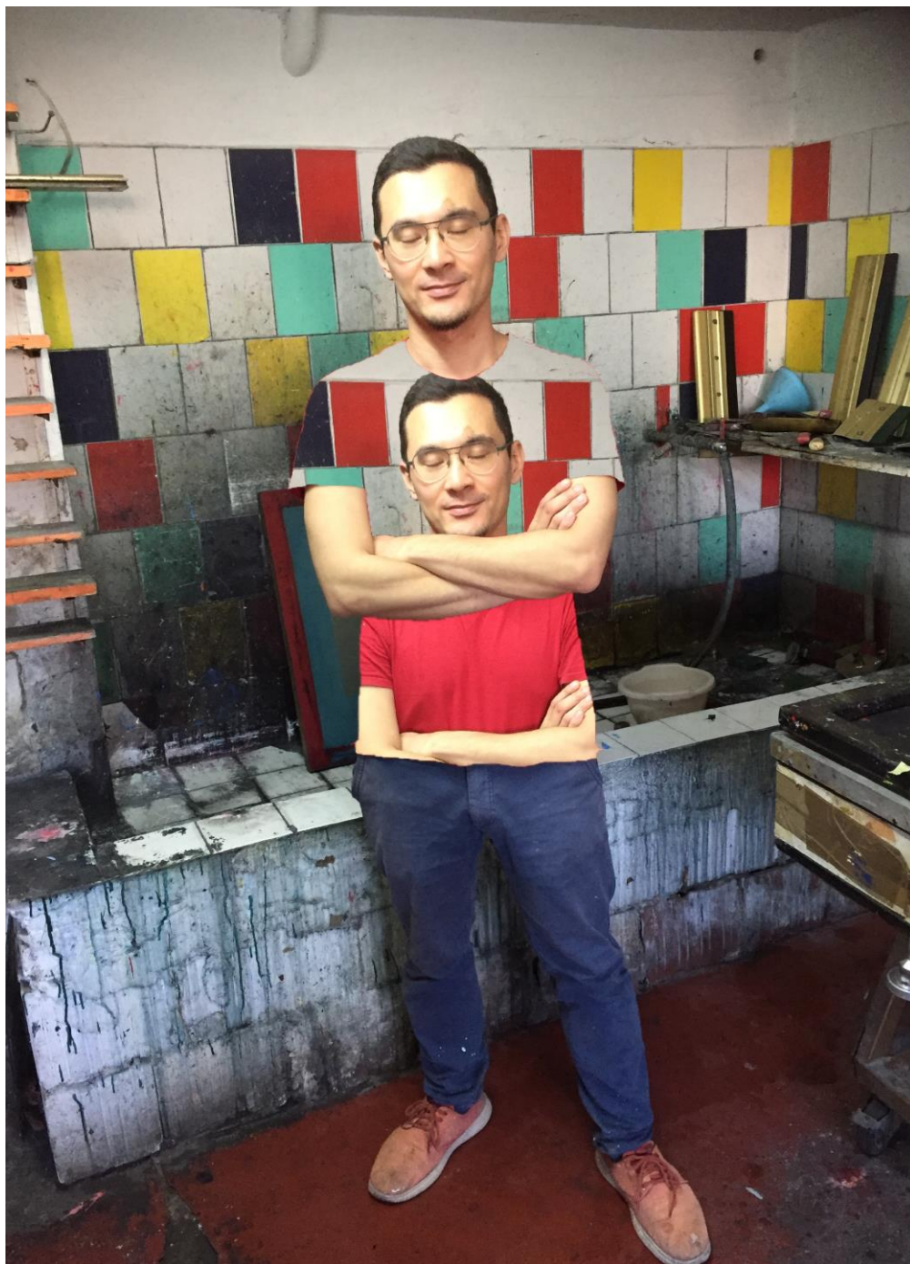
Crvena ja, 2019, fotokolaž