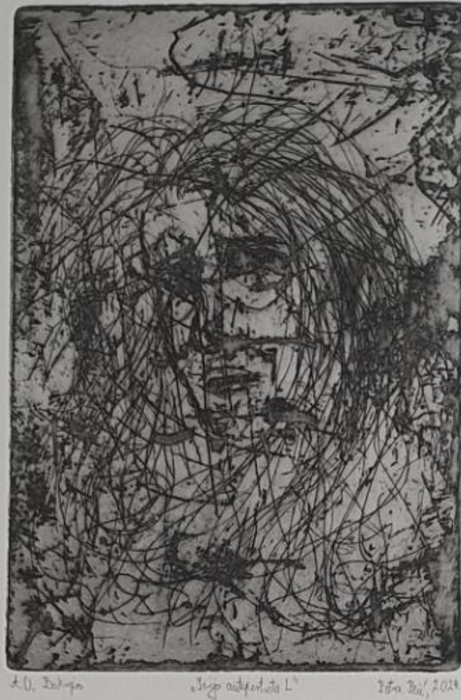
Serija autoportreta L, 2024.