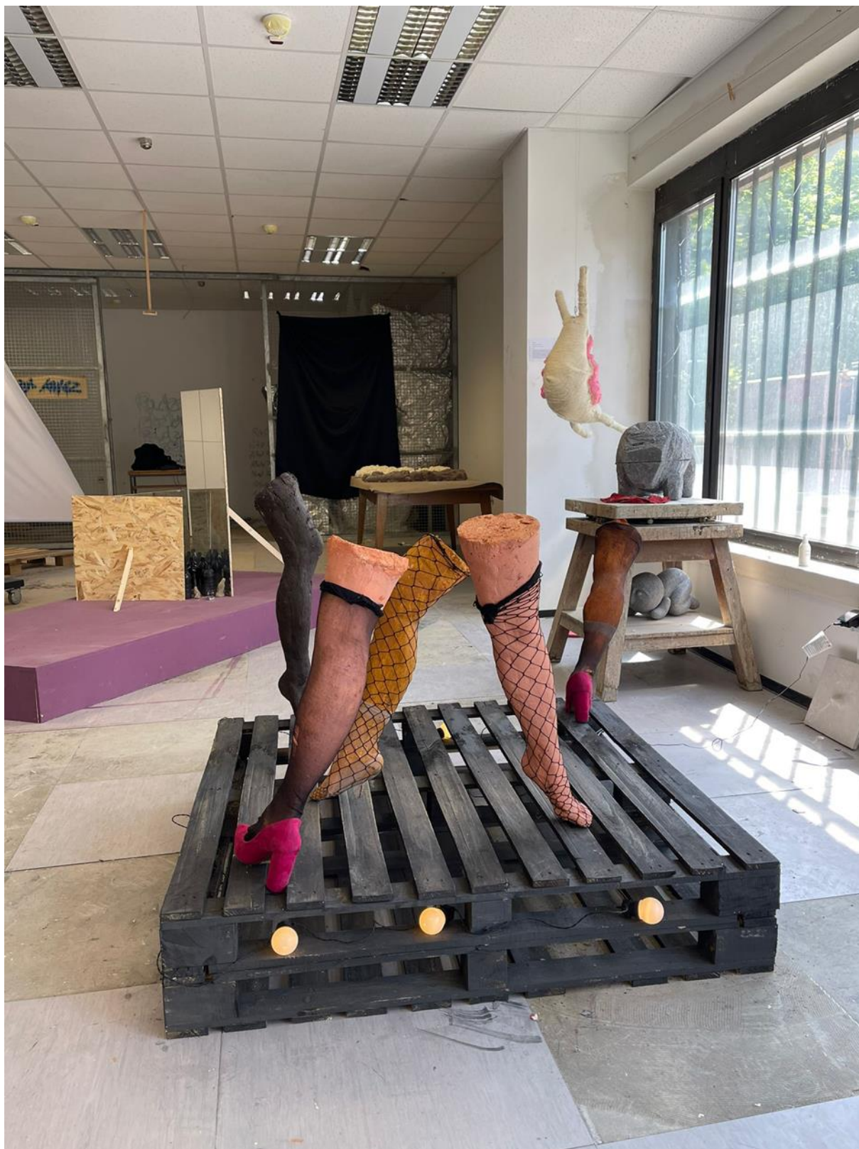
U tuđim cipelama, postament: D 120cm Š 80cm ukupna visina: 120cm