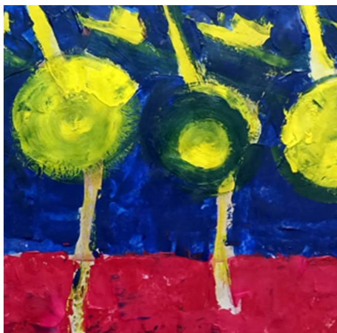
Ples živih, detalj