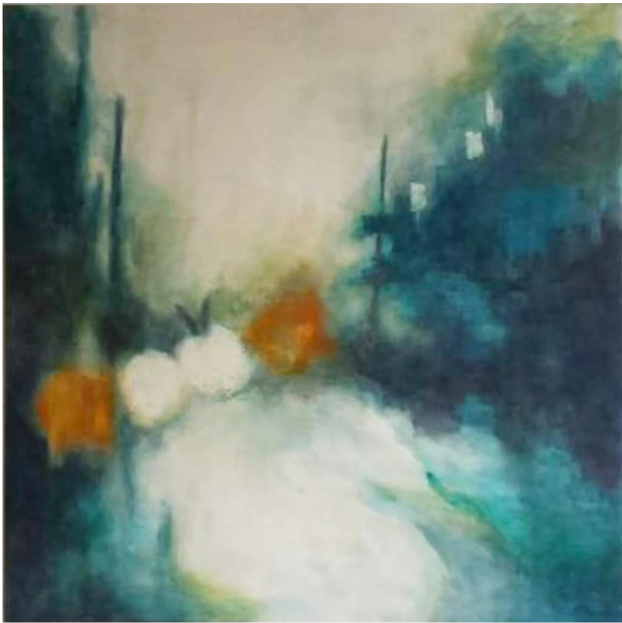
Akril na platnu, 190x190 cm