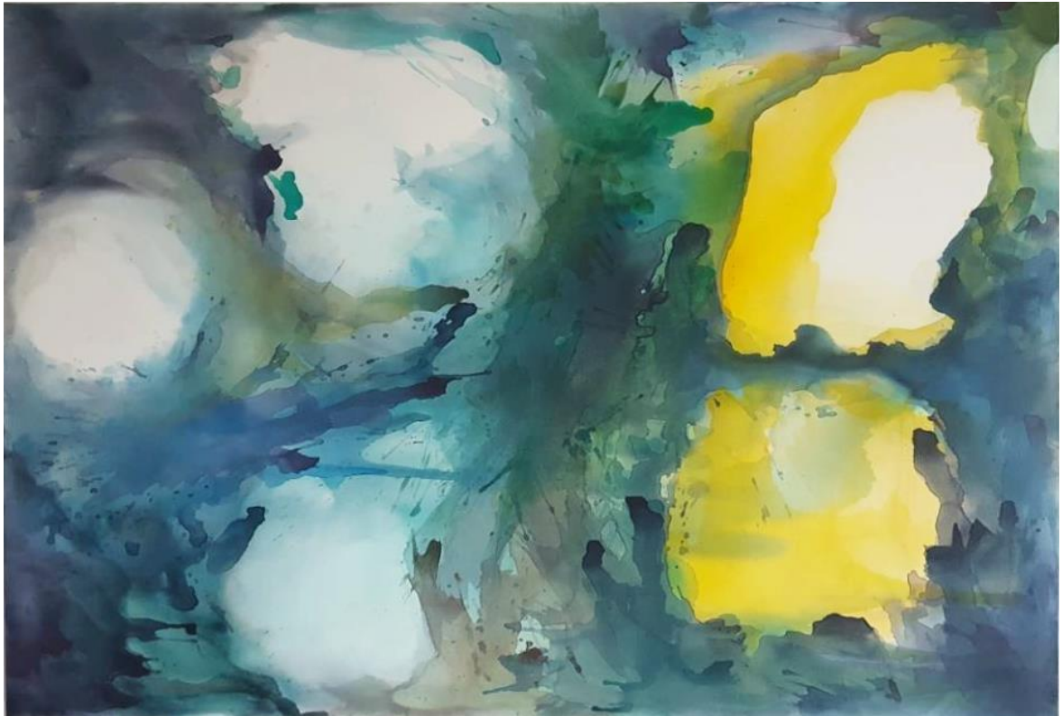
Akril na platnu, 160x110 cm