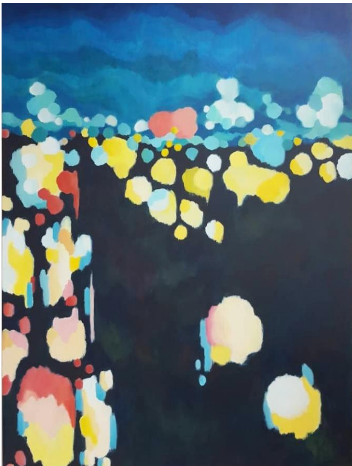
Akril na platnu, 200x140 cm