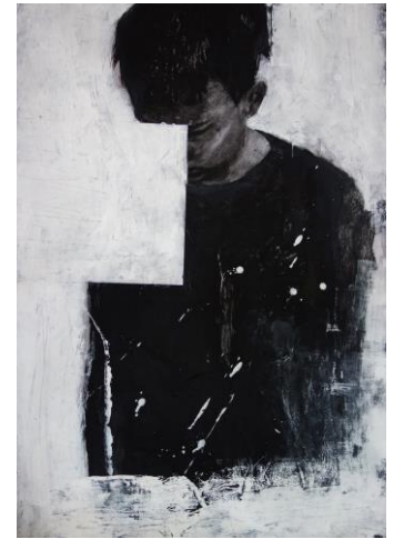
Prepreka, 2018. kolaž i akril na papiru