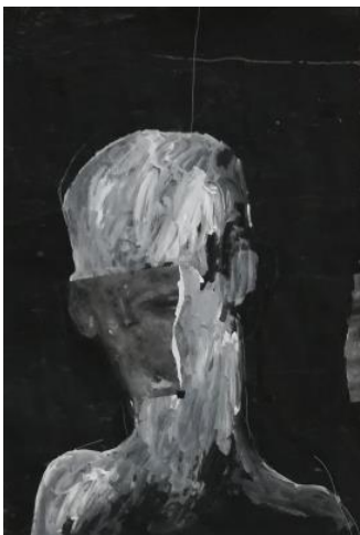
Melankolija, 2018., kolaž i akril na papiru

Eksperimentiranjem i kombiniranjem likovnih tehnika gdje se, osim kolažiranih dijelova, javljaju ekspresivne mrlje i plohe koje su grebane ili strugane pokušavam stvoriti živu, dinamičnu slikarsku površinu koja je u kontrastu sa statičnim, gotovo beživotnim, figurama koje se na njoj nalaze. Zbog takvog istraživanja tehnikama, kao sastavni dio rada, pojavljuju se slučajnost i „greška“ - elementi koji dodatno pridonose nastanku radova koji ne pružaju odgovore, već ostavljaju mogućnost subjektivne, posve vlastite likovne interpretacije.