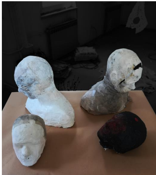
Ljuštura, 2018., kaširanje