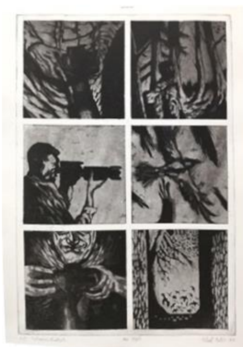
Bez riječi, 2018., bakropis i akvatinta