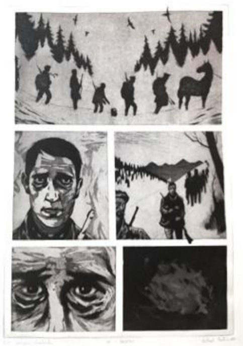
Idi i smotri, 2018., bakropis i akvatinta

Moje stripove karakterizira potpuno odsustvo teksta, što u prvi plan donosi sliku, odnosno vizualni jezik stripa. Nadalje, nepostojanje tekstualnih oblačića ostavlja dojam mističnosti i nepoznatog, te pruža mogućnost osobne interpretacije radnje koju strip donosi. Eksperimentiranje u ograničenoj, jednostraničnoj formi stripa jednako je ograničavajuće koliko i zabavno zbog likovne „igre“, odnosno traženja odgovarajućeg motivskog ili rakursnog rješenja za svaki kadar (vinjetu). Vrlo važnu ulogu pri stvaranju sveukupne, mračnije, atmosfere ovih stripova imao je tehnički aspekt njihove izrade, odnosno grafička priprema i tisak, kao i slučajnosti koje taj proces ponekad proizvede na završnom otisku. Tehnike dubokog tiska, bakropis i akvatinta, koje su korištene na ovim stripovima, omogućuju stvaranje zasićenih crnih sjena i naglašenih kontrasta karakterističnih za europske strip crtače kao što su Manu Larcenet ili Ivo Milazzo čije me stvaralaštvo inspirira.