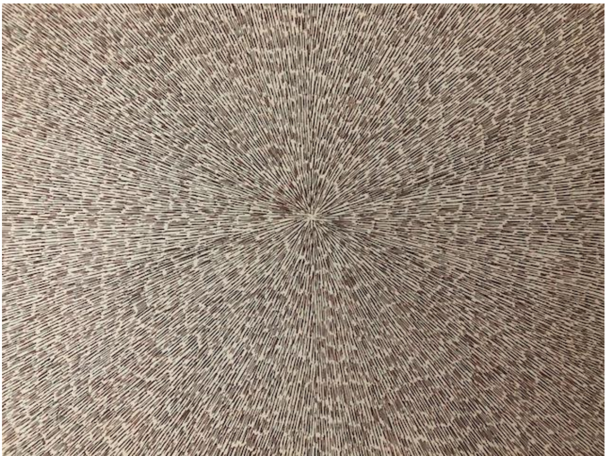
Titram , 2018., Bakropis, detalj