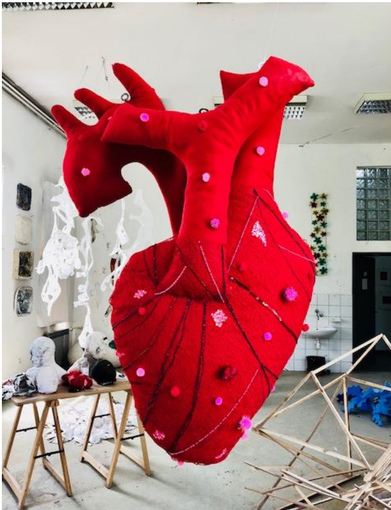
Samo se srcem dobro vidi , 2018., kombinirana tehnika