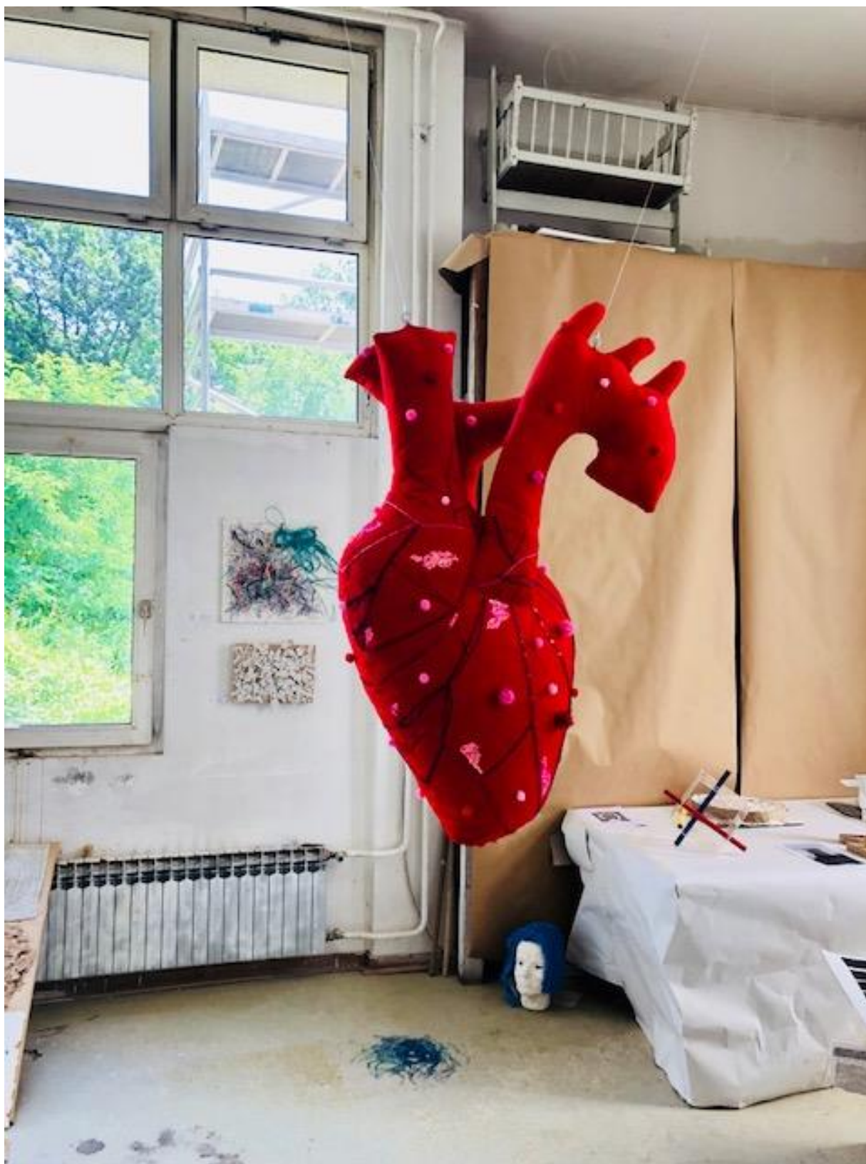
Samo se srcem dobro vidi , 2018., kombinirana tehnika