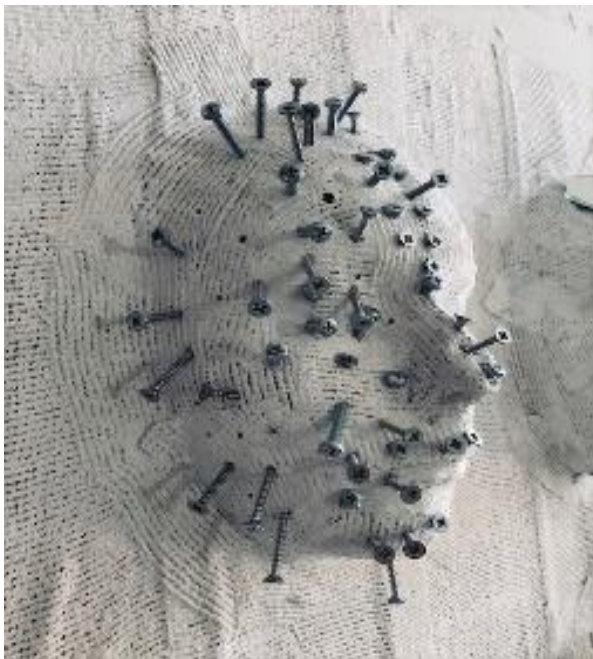
Autoportret anksioznosti, 2018., kombinirana tehnika, detalj