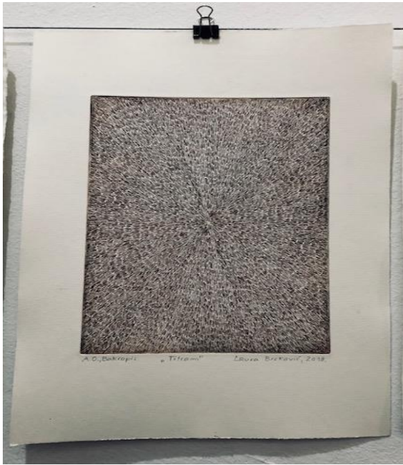
Titram , 2018., Bakropis