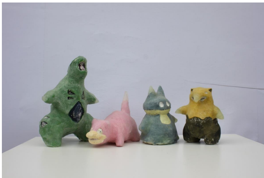
„Figure Bezbriznosti“, 2019./2020., gips/akril/silikon