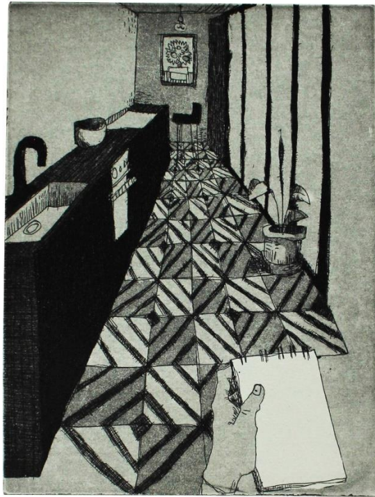
„Zapis iz karantene II“, 2020., akvatinta