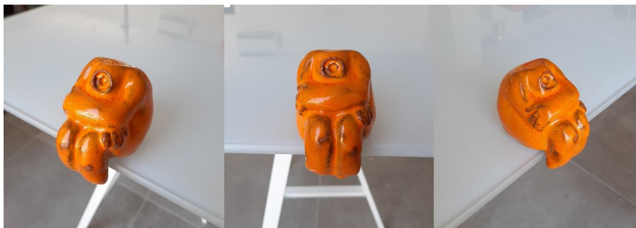
Sjedeća figura, 2020., glazirana keramika (crvena glina)