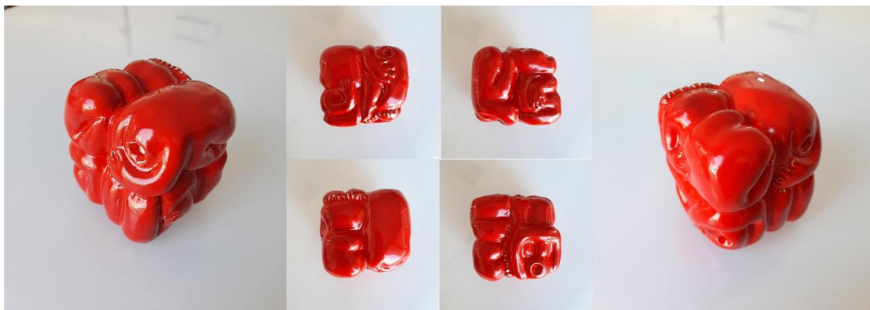
Kocka, 2020., glazirana keramika (bijela glina)