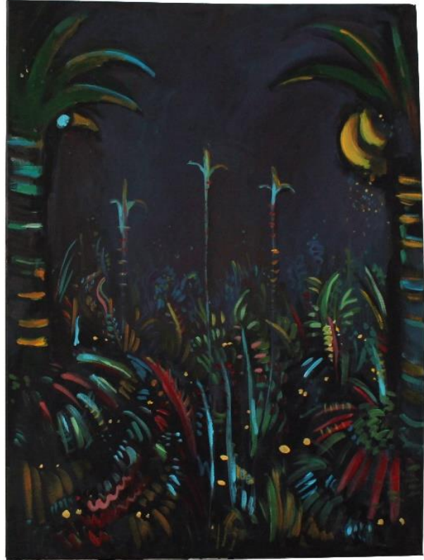
„Džungla“, diptih , 2020., akril na platnu