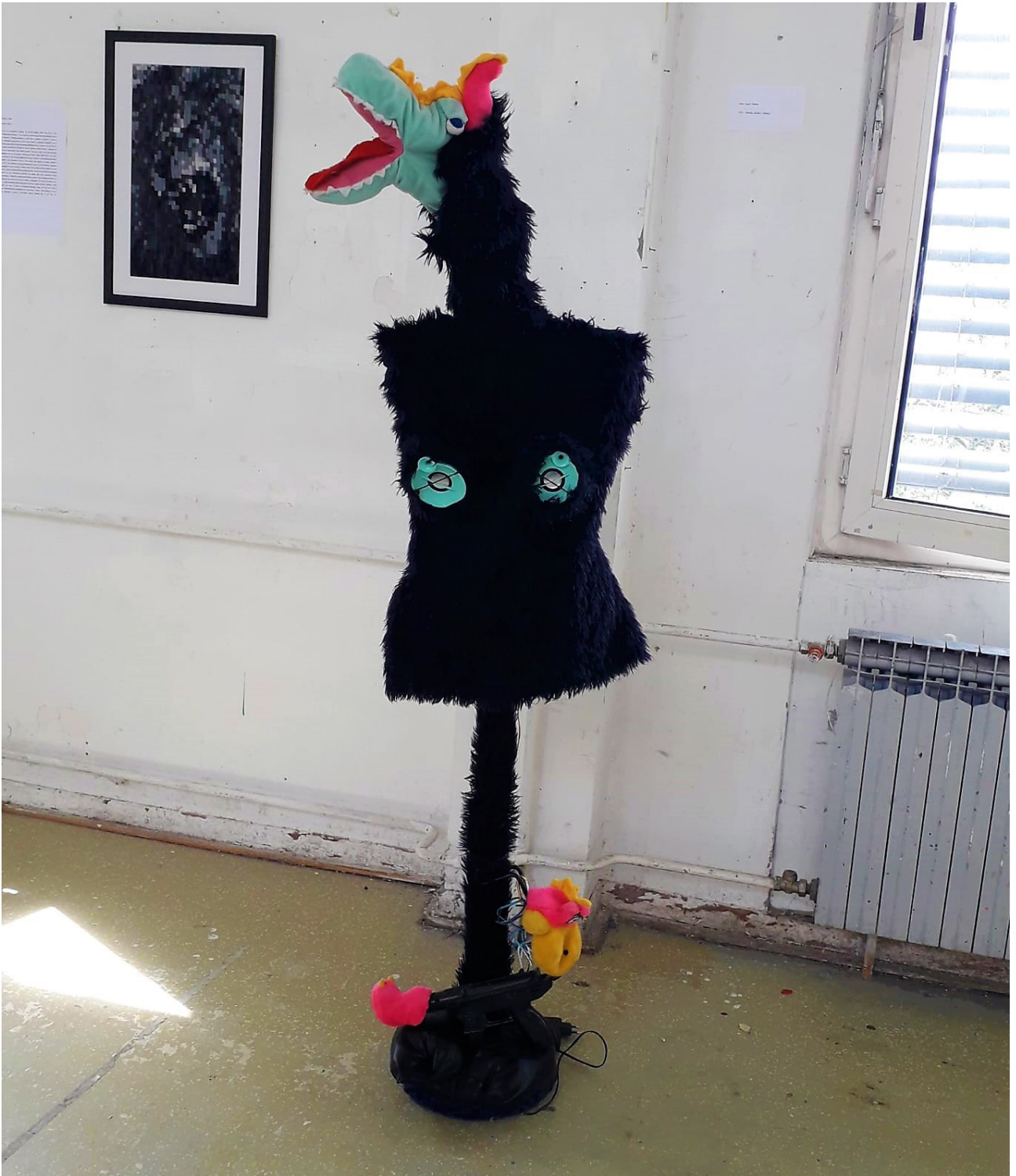
Stereo , 2020., tekstil, igračke, zvučnici