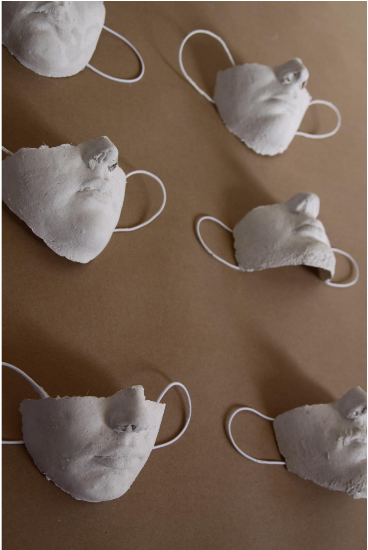
Maskiranje, 2020., gips, 10x15 cm