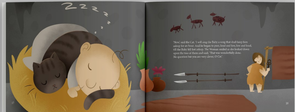
Slika 6. Mockup slikovnice, stranice 17-18