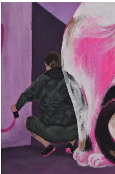
Mijić, L., detalj Noćne šetnje #3, 120x80 cm, akril na platnu, 2024.