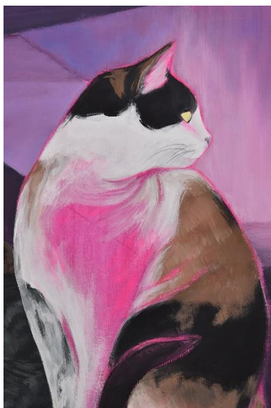
Mijić, L., detalj Noćne šetnje #3, 120x80 cm, akril na platnu, 2024.