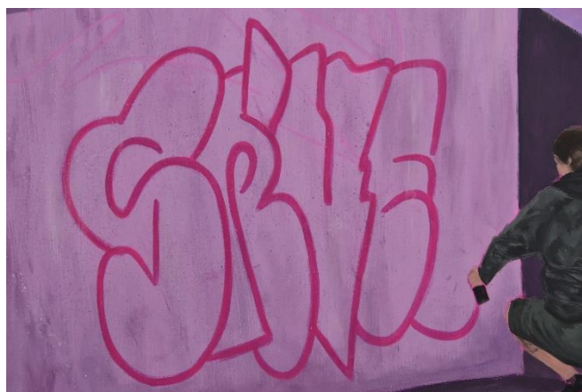
Mijić, L., detalj Noćne šetnje #3, 120x80 cm, akril na platnu, 2024.