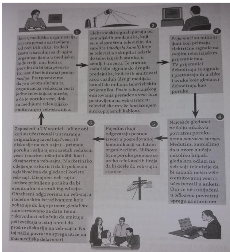
Slika 1. Model masovnih komunikacija ( Turow, 2009: 49 )

Božilović Nikola (Božilović, Petković; 184 ) smatra da masovna komunikacija je istinski posredna komunikacija u kojoj se mediji (tisak, radio, televizija, kompjuteri, internet i razne elektronske mreže) nalažu ulozu posrednika prenošenja poruka između komunikatora (koga čine specijalne društvene grupe) i komunikanta. Televizija je sveprisutna, a radio je integralni dio svakodnevnice. Promjene su dovele do toga da današnji novinari svoje intervjuje i dogovore sklapaju telefonom, elektroničkom poštom ili internetom. A feedback (povratna sprega) može biti odgođen i posredan. On se u novije doba može pratiti na sveprisutnim društvenim mrežama koje imaju mogućnost javne rasprave.