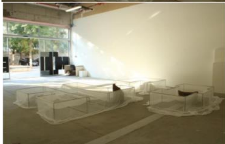
Slika 11/ 12/ 13.