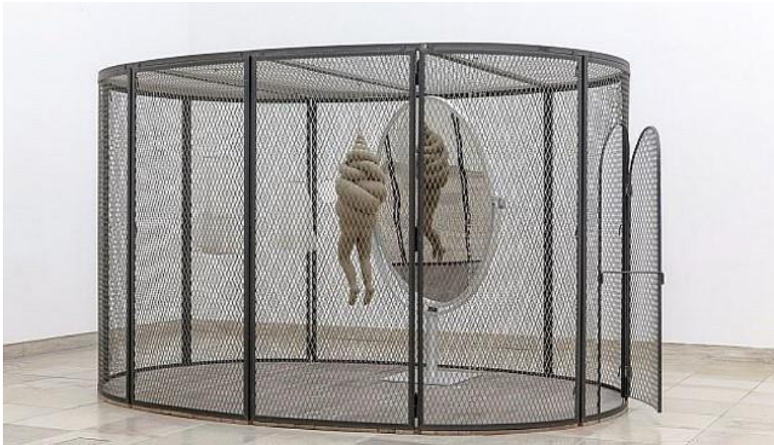
Slika 2. Louise Bourgeois, Ćelija XXVI, 2005., metal, tkanina, ogledalo

Još jedna bitna figura u polju reprezentiranja trauma u vizualnoj sferi je francuska umjetnica Louise Bourgeois koja se kroz materijale i procese u stvaranju svojih umjetničkih djela nosila sa prerađivanjem problematičnih i traumatskih sjećanjima iz djetinjstva. Serija od 60 radova pod imenom “Ćelije”, od kojih sam izdvojila primjere (slika 2. i 3.), nudi psihološki svijet vlastite borbe u eksploraciji doma iz djetinjstva, memorija i fantazija. Zatvorene forme instalacija su jedinstvene arhitektonske jedinice koje su po objašnjenju umjetnice “kuće koje udomljuju strahove”. Sagrađeni kao kavezi, svaka ćelija je ispunjena kolekcijom sakupljenih objekata koji su odraz njenog djetinjstva. U isto vrijeme zatvori patnje i kuće sigurnog raja, sadržavaju memorije traumatičnih događaja, ali isto tako i fantazije idealnog doma u smislu potrebe da rekonstruira svoju prošlost nad kojom može imati kontrolu i izmjeniti ju.