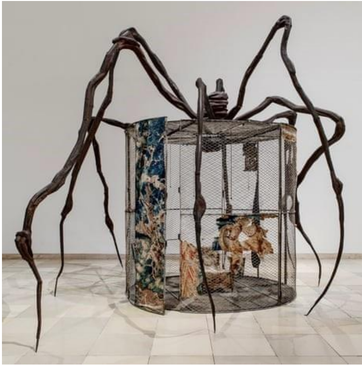
Slika 3. Louise Bourgeois, 1997., čelik, drvo, staklo, tkanina, kost, tepih, guma, srebro