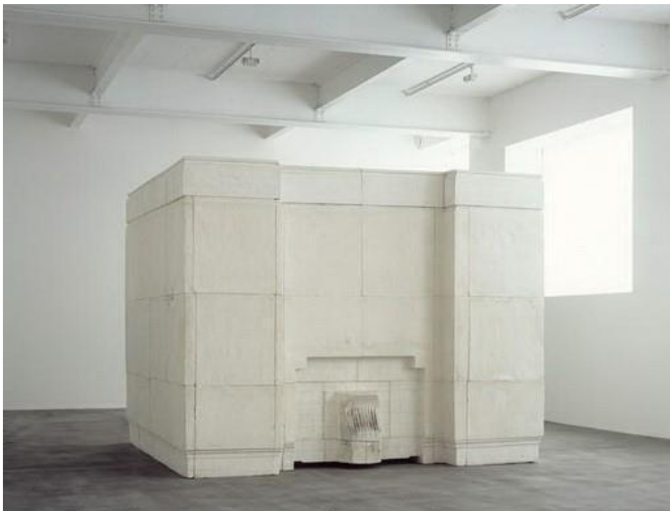
Slika 4. Rachel Whiteread, „Duh“ 1990., gips na metalnom okviru

Kao primjer ponovnog činjenja prisutnim britanska umjetnica Rachel Whiteread svoje skulpture, crteže, svakodnevna okruženja, objekte i površine transformira u sablasne replike koje bivaju jezivo prepoznatljive. Kroz tehniku lijevanja, ona oslobađa svog subjekta: kreveti, stolovi i kutije pa sve do vodenih tornjeva i cijelih kuća. Od praktične upotrebe, sugerirajući novu trajnost prožetu sa sjećanjem. Njen rad „Duh” 1990. (slika 4.) napravljen lijevanjem sobe Viktorijanske kuće u betonu, čime stvara čvrsti kalup koji je pokupio detalje zidova, prozora i kamina, Duh je pozitiv sobe u stvarnim mjerama tog objekta koji sepostupno otkriva kako ga okružujemo. Za ovaj rad kaže kako je htjela „mumificirati zrak u sobi”, naglašavajući memorijalne tonove evocirane tihim nalik na mauzolej djelom. Njena konstantna praksa reprezentiranja obiteljskih prostora (sobe, stepenice, kuće), namještaj (stolice, stolovi, madraci, police), otvara takozvane „životne odljeve” prema novim mogućnostima da njena uvjerljiva umjetnost oblikuje svijest o promjenjivom fenomenu svakidašnjeg.