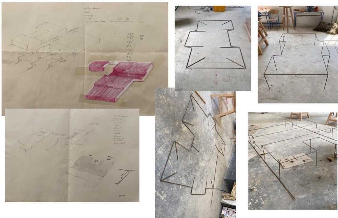
Slika 10. Skice metalnih konstrukcija te proces njihove izrade.