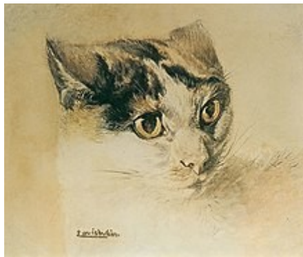
Slika 18. Luis William Wain, Realno nacrtana mačka, 1886., drvene boje, 33.8x28.5cm

Animalisti su likovni umjetnici koji u svojim radovima kao motiv pretežito prikazuju životinje. Sa sigurnošću se može reći da je gotovo svaki umjetnik barem jednom u svojim radovima izradio životinju. U popularnoj kulturi vjerojatno najprepoznatljiviji umjetnik koji je prikazivao mačke je engleski umjetnik Louis William Wain koji je popularnost stekao zbog svojih crteža mačaka koje igraju golf, piju čaj ili su prikazane u nekim drugim radnjama specifičnim za ljude pri kojima se mogu očitati i neke ljudske osobine. Pisac H. G. Wells napisao je da je Wain izumio mačji stil, mačje društvo, cijeli mačji svijet te da se engleske mačke koje ne izgledaju i ne žive kao mačke Louisa Waina srame same sebe. (Stokes, 2021) Njegova djela postajala su slavna preko noći jer nisu prikazivala samo mačke nego i ljudske osobine mačaka. Na slikama 18. i 19. možemo vidjeti Wainova djela s početka i kraja njegove karijere.