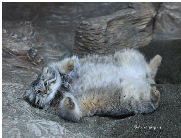
Slika 26. Ležeća Pallas mačka