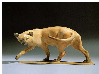
Slika 17. Gill Parker, Veslačka mačka, 2022., bronca, 17.8.x30 cm