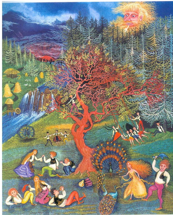
Slika 3. Cvijeta Job, ilustracija za bajku "Regoč"

Prema Hlevnjak i Ivanuš (2022) Cvijeta svojim minijaturama unosi novu dimenziju umjetnosti u Hrvatsku, a jedno od najznačajnijih djela ilustracije su za knjige Ivane Brlić-Mažuranić. Cvijetine, podosta osebujne, ilustracije zbog bogatih detalja, jedinstvenoga pristupa, izbora boja i lišavanja dobnog ograničenja postale su prepoznatljivi simbol priče koju interpretiraju.