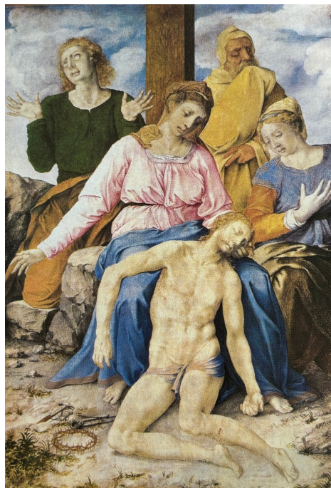
Slika 2. Julije Klović, “ Oplakivanje Krista ”

“Bio je vrlo cijenjen i neobično hvaljen od suvremenika (prozvan je Michelangelo minijature), poslije pak zaboravljen i djelomice osporavan; tek s novim istraživanjima i interpretacijama uočen je njegov doprinos europskoj i hrvatskoj likovnoj umjetnosti” (Hrvatska enciklopedija, mrežno izdanje).