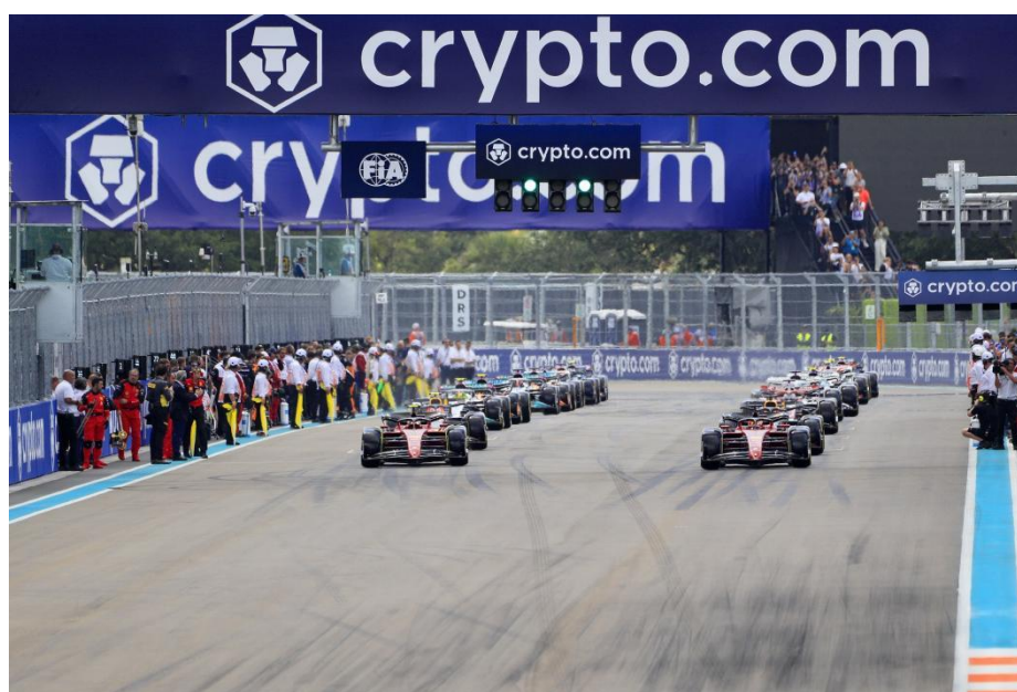
Slika 9. Oglasi naslovnog sponzora VN Miamijske, Crypto.com

Sponzorstvo u Formuli 1 složen je proces koji zahtijeva više koraka, pravne ugovore i stručne pravne savjete. Može obuhvaćati različite oblike podrške, uključujući novčane uplate, bonuse i opskrbu. Rezultati timova iz prethodnih sezona često su pozitivno povezani s komercijalnim sponzorstvom, nagradama, prodajom sportske opreme i pravima za televizijske prijenose. Slabiji timovi obično veći dio svojih prihoda ostvaruju putem nagrada i vlasničkih ulaganja. U šezdesetim godinama prošlog stoljeća pioniri poput Brucea McLarena i Colina Chapmana razvili su moderne strategije sponzorstva u Formuli 1, surađujući s američkim stručnjacima koji su znali kako komunicirati sa sponzorima na način koji u Europi tada nije bio uobičajen. U Formuli 1 razlikuju se dva glavna tipa sponzorstva: manje vidljivo sponzorstvo, koje često uključuje opskrbu, i više vidljivo sponzorstvo, koje obuhvaća reklamiranje na bolidima i stazi. S obzirom na rast broja gledatelja i obožavatelja koji posjećuju utrke, pretplaćuju se na televizijske kanale ili koriste digitalne usluge, vrijednost sponzorstava u Formuli 1 značajno je porasla. (Cobbs et al., 2017.)