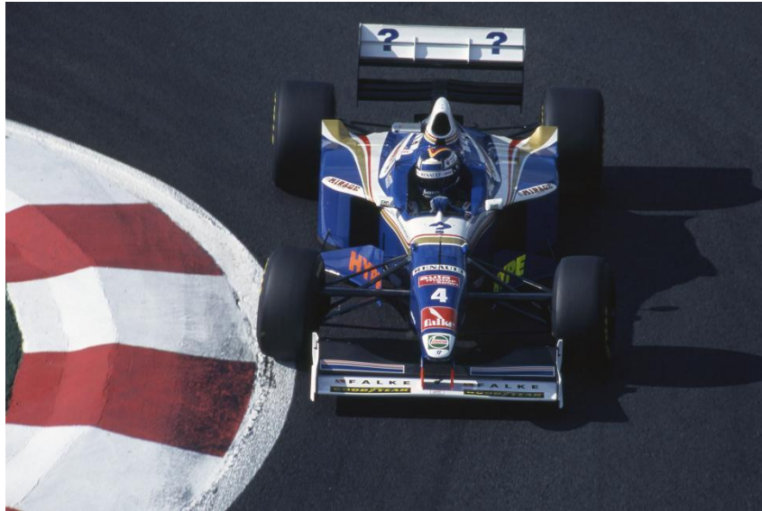
Slika 11. Williamsow FW19 bolid