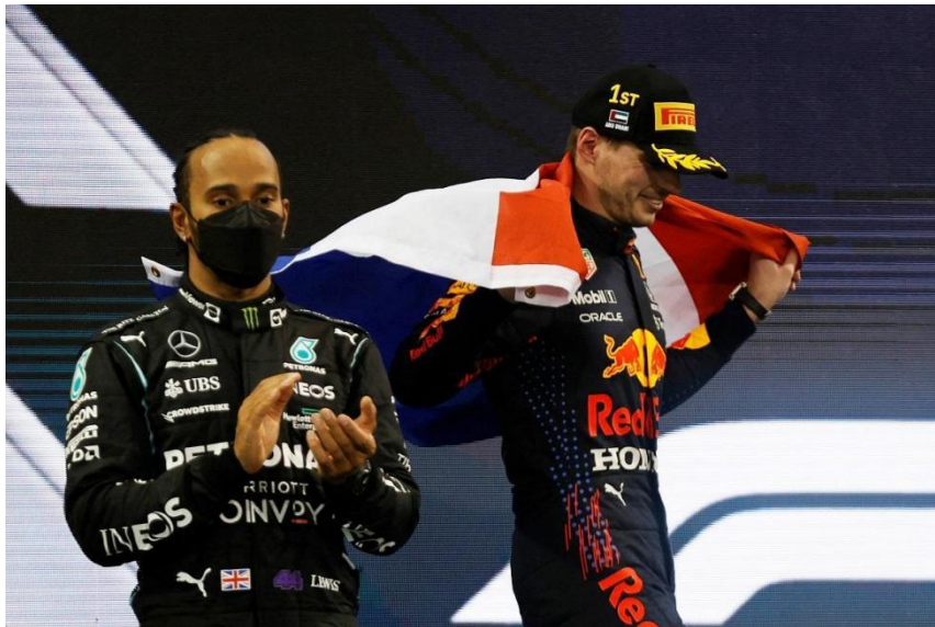
Slika 6. Max Verstappen slavi naslov svjetskog prvaka, 12. prosinca 2021.

prekinuti njihovu vlast. U 2020. godini, Lewis Hamilton je ispisao povijest osvojivši svoj sedmi naslov i tako izjednačio rekord Michaela Schumachera, unatoč smetnjama koje je izazvala pandemija COVID-19. Međutim, 2021. godina označila je značajnu promjenu kada je Max Verstappen napokon okončao Hamiltonovu vladavinu postavši svjetskim prvakom. Iako je Mercedes zadržao naslov konstruktora, uvođenje sprint utrka dodalo je napetost sezoni. (Službena stranica Formula one art & genius, pristupljeno 3.8.2023.) No, priča nije završila tamo. U 2022. godini, Red Bull Racing i Max Verstappen nastavili su svoj uspon, osvojivši oba naslova. Ova pobjeda označila je novo razdoblje u Formuli 1, s Verstappenom i Red Bullom koji su svrgnuli nekada nepobjedivi Mercedes i Hamiltona. Uz sve to, Ferrari je ostvario impresivan povratak u 2022. godini, predvođeni Carlosom Sainzom i Charlesom Leclercom koji su pokazali svoje talente i gurnuli tim u sam vrh borbe za prvenstvo. Formula 1 je zakoračila u uzbudljivo novo razdoblje s više konkurenata koji se nadmeću za slavu, obećavajući navijačima još uzbudljivih sezona u budućnosti.