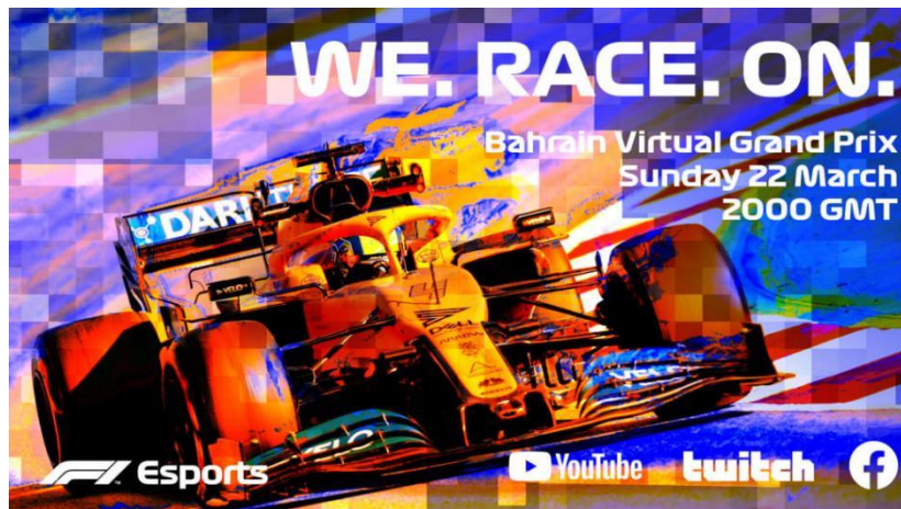
Slika 8. Promotivni plakat F1 EVGP događaja iz 2020. godine