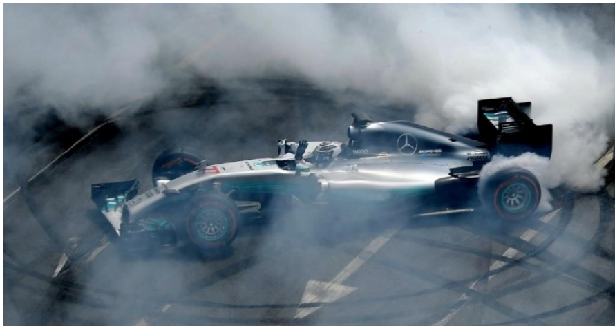
Slika 14. Valtteri Bottas u Mercedesovom bolidu

Plan je da do 2030. godine ovaj sport ostvari neto nultu emisiju CO 2 , što će se postići prelaskom na već spomenuta 100% održiva goriva. Organizacija je proteklih godina uložila značajne napore kako bi smanjila svoj ekološki otisak putem revizije pravila o motorima i održavanjem održivih događanja. Ovi su napori odgovor na višestruke prosvjede i optužbe o negativnom utjecaju sporta na okoliš i njegovom doprinosu globalnom zatopljenju. Značajan napredak postignut je 2014. godine, kada su veliki V8 motori zamijenjeni manjim, ali učinkovitijim 1,6-litarskim V6 turbo hibridnim motorima. Najnovija generacija motora koristi hibridnu tehnologiju i dva sustava za oporavak energije, uz bateriju koja vozaču pruža više snage uz manju potrošnju goriva. Spremnici goriva u vozilima Formule 1 gotovo su prepolovljeni u usporedbi s erom V8 motora, ali automobili i dalje mogu prijeći istu udaljenost tijekom utrke, što pokazuje da su vozila postala učinkovitija u potrošnji goriva. KERS (Kinetic Energy Recovery System) bio je prvi sustav za oporavak energije koji se koristio u Formuli 1, uveden 2009. godine. Kasnije je poboljšan 2014. godine, omogućujući do 160 konjskih snaga tijekom 33 sekunde po krugu, što je dvostruko više snage od prethodnog sustava i može se koristiti znatno duže. (Službena stranica Flow Racers, pristupljeno 19.8.2023.)