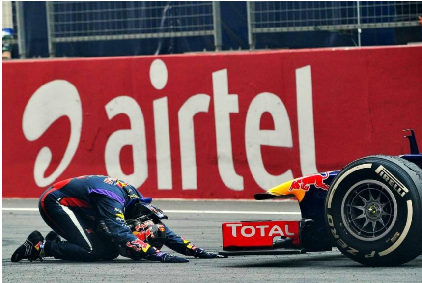
Slika 5. Sebastian Vettel se klanja svojem pobjedničkom RB9 bolidu 2013. godine.