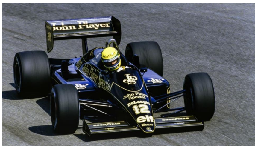
Slika 10. Ayrton Senna u bolidu momčadi Lotus, stiliziranom u bojama JPS cigareta

Sponzorstva duhanskih proizvoda u Formuli 1, unatoč početnim zabranama, odigrala su ključnu ulogu u marketinškoj strategiji sporta. Godine 1968. Imperial Tobacco prekršio je te zabrane postavši prvi komercijalni sponzor u povijesti F1, s ugovorom vrijednim 85.000 funti godišnje. Taj događaj otvorio je vrata sve većem angažmanu duhanskih tvrtki u sportu, a vrhunac njihova utjecaja bio je vidljiv u ikoničnom crno-zlatnom izdanju Lotus ekipe u razdoblju od 1972. do 1978. godine, kada su JPS logotipi tvrtke Imperial krasili bolid. Ekipe je osvojila tri svjetska prvenstva, što je jasno pokazalo koliko veliki sponzori, sa svojim financijskim potporama, mogu utjecati na uspjeh pojedinih timova. (Službena stranica Medium, pristupljeno 18.8.2023.)