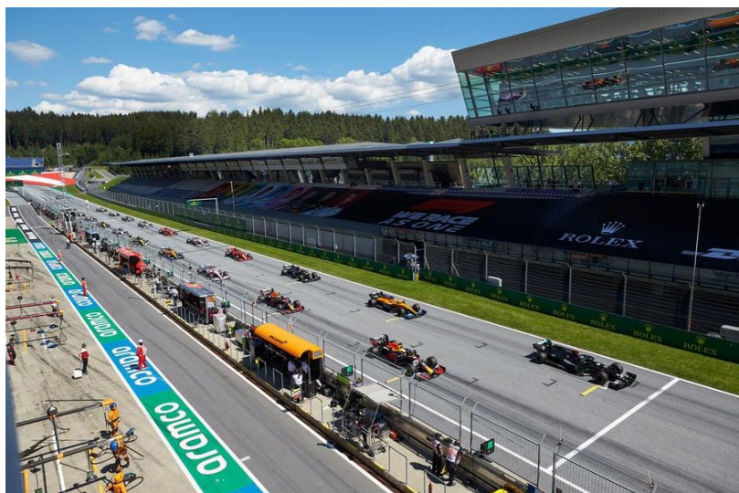
Slika 13. Prazne tribine na prvoj utrci sezone u Austriji tijekom pandemije Covid-19.

Red Bull Racingu i Red Bull Teamu porastao je s 866 na 934, čime su se gotovo izjednačili s brojem zaposlenih u Mercedesu. McLaren Racing ostvario je izniman financijski uspjeh u odnosu na prethodno razdoblje, s prihodom od 333 milijuna funti i dobiti od 136 milijuna funti, što predstavlja impresivan rast od čak 400%. Međutim, značajan dio tih brojki rezultat je prodaje naslijeđene imovine sestrinskoj tvrtki. Kada se ti podaci isključe, ukupan prihod tima smanjuje se na 160 milijuna funti, što predstavlja pad od 12% u odnosu na prethodnu godinu, kada je iznosio 178 milijuna funti. Gubitak, isključujući prihode od naslijeđene imovine, iznosio je 36 milijuna funti, jednako kao i u 2019. godini. Broj zaposlenih u timu porastao je na 841 u 2021. godini, što je u skladu s proračunskim ograničenjem od 145 milijuna dolara. (Službena stranica Race fans, pristupljeno 24.8.2023.)