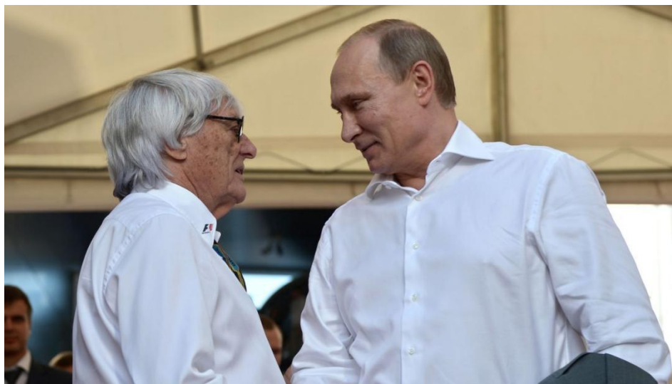
Slika 7. Bernie Ecclestone i ruski predsjednik Vladimir Putin na VN Rusije u Sočiju.