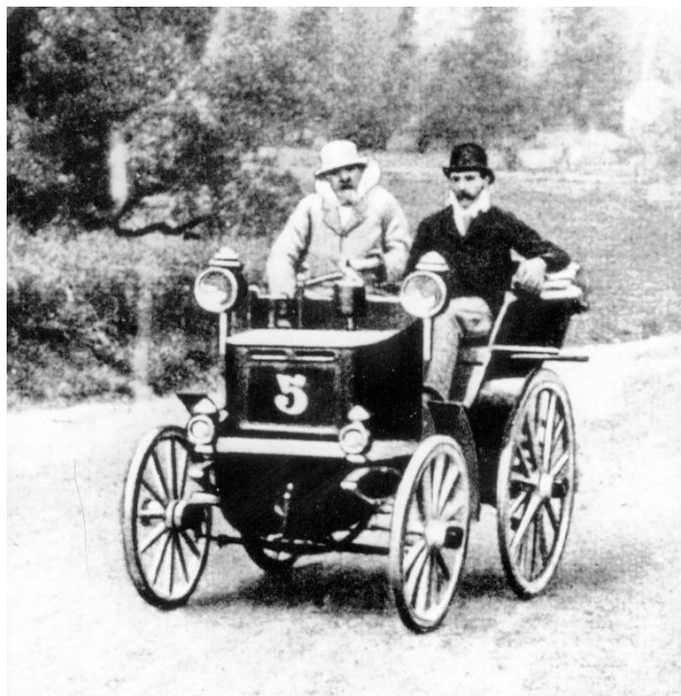
Slika 2. Emile Levassor i Charles d'Hostingue u utrci Pariz-Bordeaux-Pariz, 1895.

Monako dogodio se istovremeno sa smanjenjem minimalne duljine utrke na 300 km, što se poklopilo s najavom FIA o planovima za Svjetsko prvenstvo u automobilskim utrkama, označavajući početak novog razdoblja. (Službena stranica Formula one art & genius, pristupljeno 3.8.2023.)