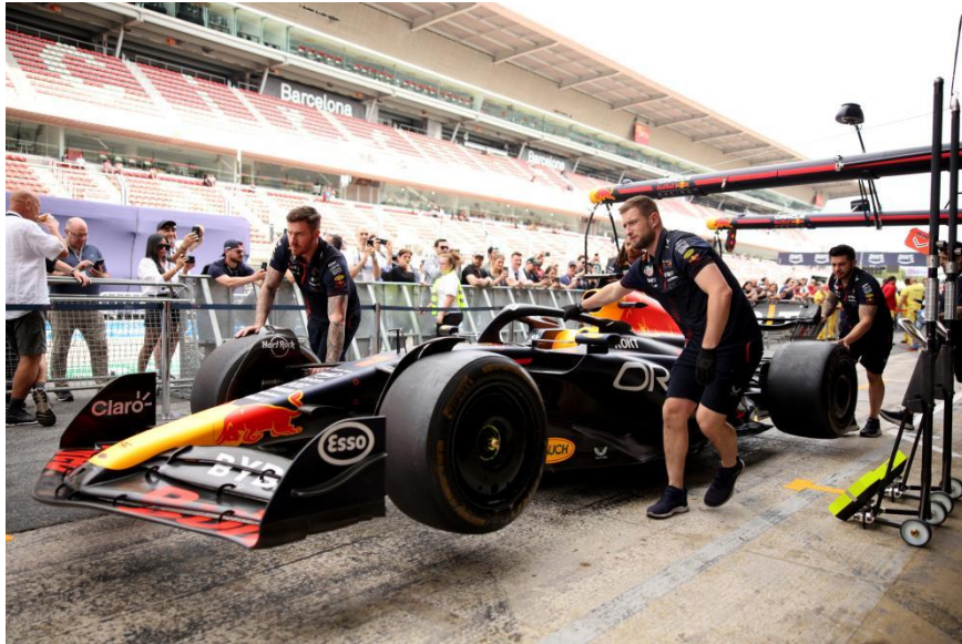
Slika 1. Boks momčadi Red Bull Racinga na VN Španjolske.