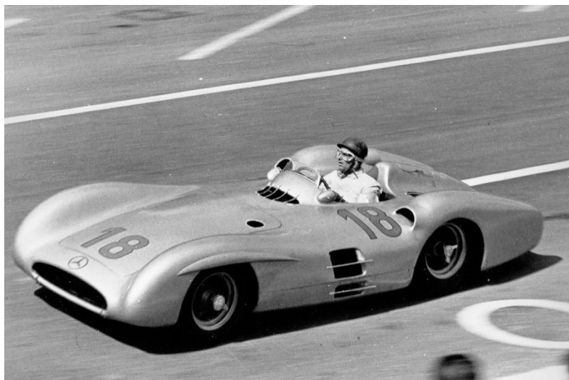
Slika 3. Juan Manuel Fangio u Mercedesu W196 na VN Francuske u Reimsu.

aerokrilca, što je donijelo koncept aerodinamičkog potiska. Ova krila poboljšala su prijanjanje i brzinu pri vožnji u zavojima, pomičući granice utrivanja. Međutim, rani eksperimenti s visoko postavljenim stražnjim krilima stvarali su sigurnosne izazove, uključujući rizik od nesreća uzrokovanih otpadanjem krila. Sezona 1975. svjedočila je usponu Ferrarija s Niki Laudom i Clayem Regazzonijem, no postojala su pitanja sigurnosti. Laudina nezaboravna nesreća na Nürburgringu 1976. godine, nakon čega je napravio izvanredan povratak, istaknula je nevjerojatnu hrabrost vozača Formule 1. (Službena stranica Formula one art & genius, pristupljeno 3.8.2023.)