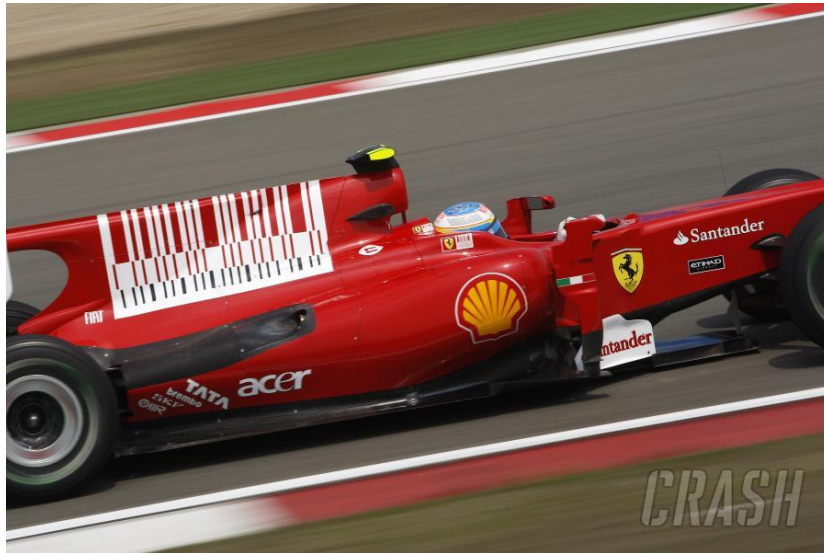
Slika 12. Ferrarijev bolid sa prepoznatljivim Marlboro barkodom.

Još jedna zanimljiva situacija dogodila se tijekom Velike nagrade Rusije 2021., kada se na McLarenovom automobilu pojavio logo OXXO, meksičke samoposlužne trgovine. OXXO nikada nije platio za oglašavanje; umjesto toga, BAT je platio za tu promociju jer je OXXO mjesto gdje većina ljudi u Meksiku kupuje cigarete. (Službena stranica One Stop Racing, pristupljeno 16.8.2023.)