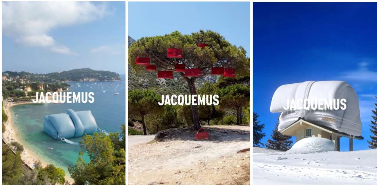
Slika 9. Scene videozapisa stvorene digitalnom 3D tehnikom prikazuju Bambino torbe u raznim situacijama

Digitalne tehnologije revolucionirale su način poslovanja poduzeća, od načina na koji komuniciraju s klijentima do načina na koji strukturiraju svoje interne operacije. Tvrtnice sada mogu iskoristiti digitalne tehnologije za stvaranje učinkovitijih i djelotvornijih procese kao i za stvaranje novih proizvoda i usluga koje ranije nisu bile moguće (Rathore, 2021). Jacquemusov marketinški tim pronašao je formulu uspješnih objava u obliku gerile, točnije 3D umjetnosti koja je zaintrigirala njihove pratitelje, ali i brojne druge. Zanimljive videosadržaje plasirali su umjereno u kombinaciji s ostalim objavama. Unatoč uspjehu takvog sadržaja, nisu ga koristili prekomjerno i zasitili publiku, već su ga dozirali povremenim objavljivanjem. Potaknuli su nagađanja i rasprave te nagomilali milijune pregleda i tisuće interakcija. Medium , Culted , Brand Insider , Hypebeast samo su neki od internetskih portala koji su pisali o uspjehu Jacquemus marketinga u svojim člancima. Uspješno su promovirali svoj brend i proizvode te postigli ono čemu svaka uspješna tvrtka teži – privući pažnju.