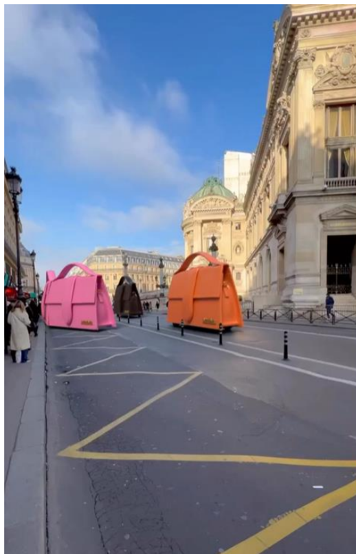
Slika 8. Prizor uvećanih verzija Jacquemus torbi u Parizu

U travnju 2023. godine brend je objavio video na svojim profilima društvenih mreža koji prikazuje njegove prepoznatljive modele torbi naziva „Bambino“ u iznimno uvećanoj verziji kako se voze ulicama Pariza. Prolaznici neometano hodaju pločnikom, a ostatak prometa odvija se bez ikakvih problema. Na jednom dijelu kolnika ispisane su riječi „BAMBINO“ i „JACQUEMUS“ u stilu prometnih oznaka. Ovaj video od samo sedam sekundi ubrzo je skupio milijune pregleda, ali je u isto vrijeme i zaintrigirao korisnike društvenih mreža. Dok se veliki dio publike divio ideji, mnoge je ova objava zbunila ne znajući radi li se o stvarnom događaju ili je sve inscenirano naprednom tehnologijom. Naime, snimka izgleda prilično realno pa se moglo pomisliti kako su autobusi ili neka slična vozila „obučena“ u torbe i tako se vozaču gradom u sklopu marketinške kampanje. S druge strane, pogledavši video bolje, očito je kako prednji dio „vozila“ nema stakla koje bi omogućilo preglednost i sudjelovanje u prometu. Zbog toga se počelo nagađati kako je cijela scena ipak proizvod računalno generirane grafike (CGI) ili umjetne inteligencije (AI). Ispod objave osim brojnih pohvala, mnogi su se pitali je li prizor stvaran, a neki su korisnici podijelili video sa svojim teorijama o istinitosti cijelog događaja.