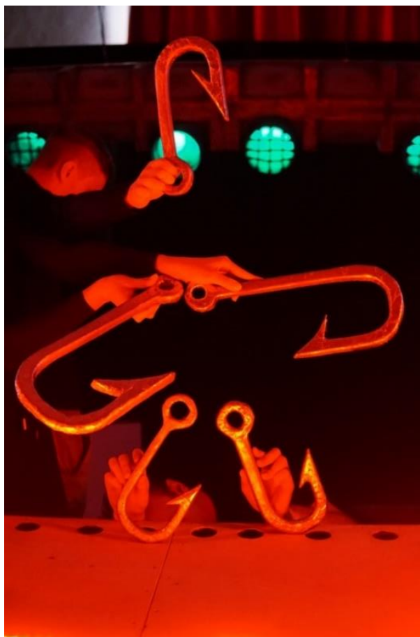
Slika 11. Čudovište složeno od udica.

Osim lutaka, svjetla i pomoćne animacije u predstavi Na tragu animirala sam i predmete. Proučavala sam kako bi se sendvič, konzerva, koktel od algi ili plastična vrećica kretale pod vodom. Također, u drugoj sceni animirane su velike kaširane udice. Lik glumca Gorana Grgeča bori se protiv udica tijekom snimanja akcijskog filma. Scena filma osmišljena je kao koreografija u kojoj se riba grgeč provlači između plivajućih udica i bježi od njih dok ga udice love. Naposljetku, budući da ga nisu uspjele uloviti, udice se dogovore da će se pretvoriti u „čudovište“. Animatori kroz koreografiju na sceni slažu „čudovište“ spajanjem udica u oblik čovjeka. Na Slici 11. nalazi se prikaz tako animiranog „čudovišta“. Udica koju animira Petra Cicvarić postaje glava, dvije udice postaju noge te ih animira Vanja Gvozdić, a dvije udice postaju ruke koje ja animiram. Čudovište hoda pokušavajući rukama upecati Grgeča, no on ih uspijeva pobijediti.