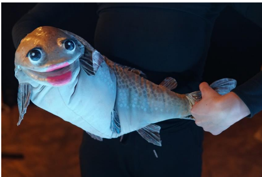
Slika 3. Položaji animatorovih ruku u odnosu na lutku koja pliva.

Izvor: Petra Cicvarić (15. listopada 2019.)