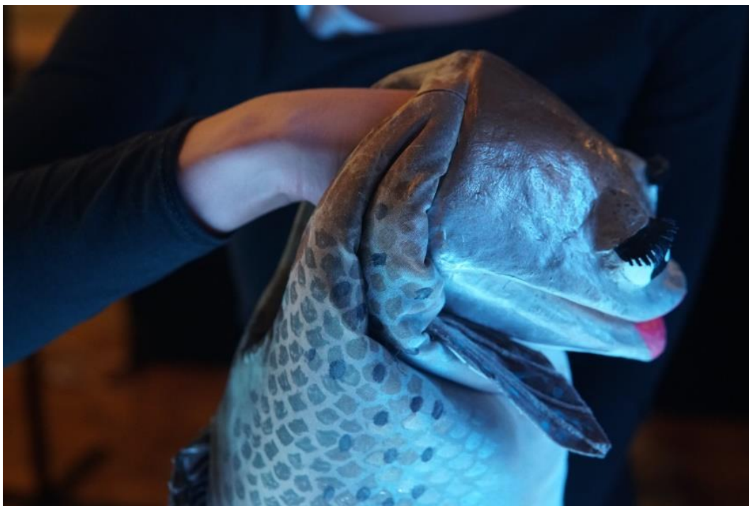
Slika 2. Položaj animatorove ruke u lutkinjoj glavi.

Izvor: Petra Cicvarić (15. listopada 2019.)