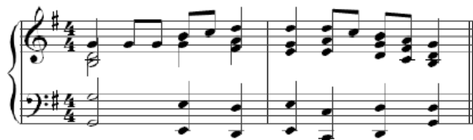
Slika 2: Zadatak iz druge serije

Zadatke za regionalni sluh osmislio je na način da se ispitaniku zadaje jedan ton na klaviru, a on ga mora pronaći.