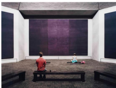
Slika 16. Mark Rothko, Rothko Chapel , 1971.