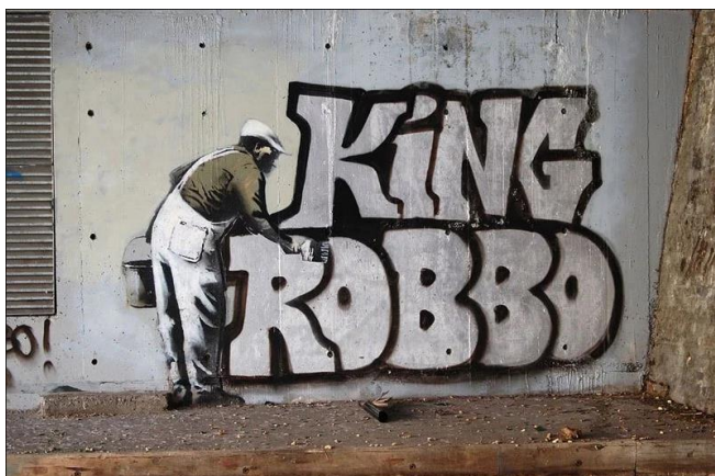
Slika 8. Banksy, King Robbo, Bez naziva , 2010.