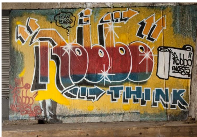
Slika 14. Članovi tima „King Robbo“, Bez naziva , 2011.