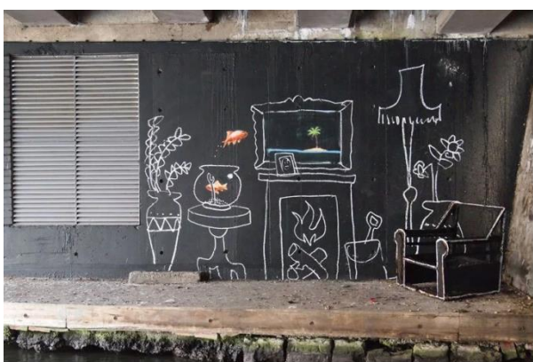
Slika 12. Banksy, Bez naziva , 2010.