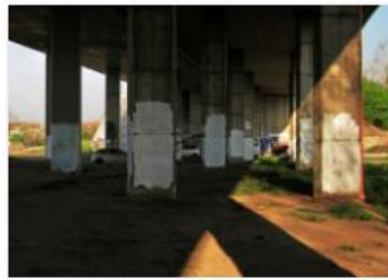
Slike 19. Marin Meković, Prostor , 2019.