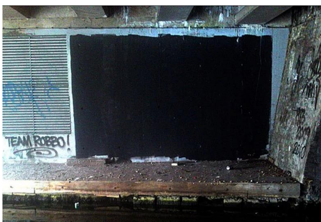
Slika 9. Autor nepoznat, Bez naziva , 2010.