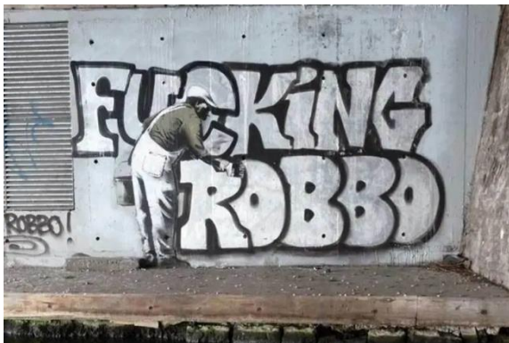
Slika 7. Banksy, King Robbo, Bez naziva , 2010.