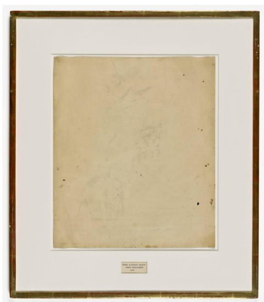
Slika 4. Robert Rauschenberg, Izbrisan de Kooning , ( Erased de Kooning ) 1953.