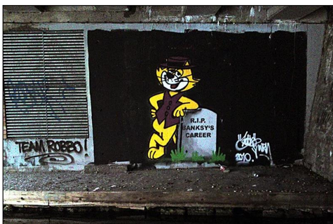
Slika 10. King Robbo, Bez naziva , 2010.