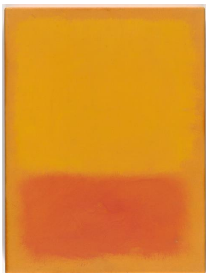
Slika 15. Mark Rothko, Bez naziva , 1968.