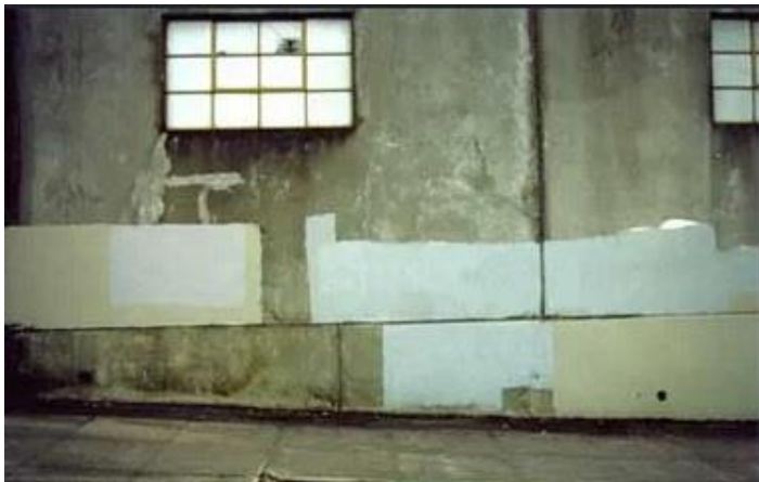
Slika 2. Matt McCormick, Podsvjesna umjetnost uklanjanja grafita , (eng: Subconscious art of graffiti removal ) 2001.