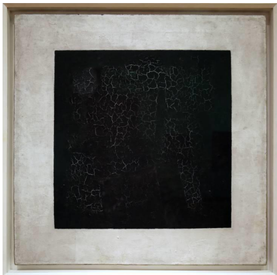
Slika 17. Kazimir Maljevič, Crni kvadrat , 1915.