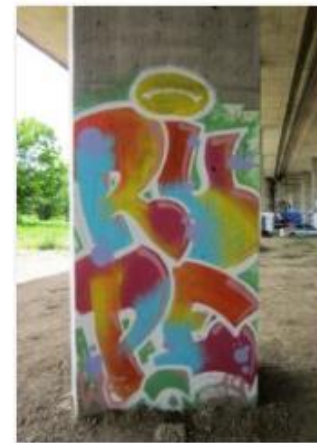
Slike 20. Autor nepoznat, Interakcija , 2019.