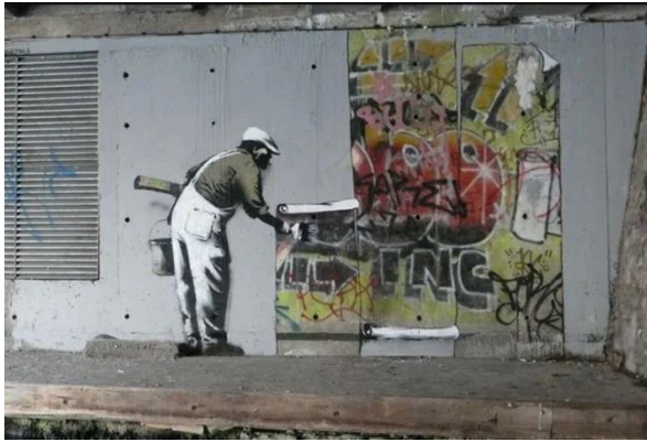
Slika 5, Banksy, King Robbo, Bez naziva , 2009.