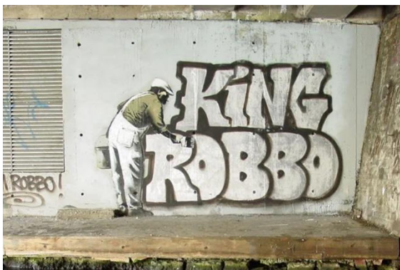
Slika 6. Banksy, King Robbo, Bez naziva , 2009.