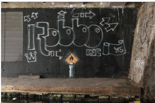
Slika 13. Banksy, Bez naziva , 2011.