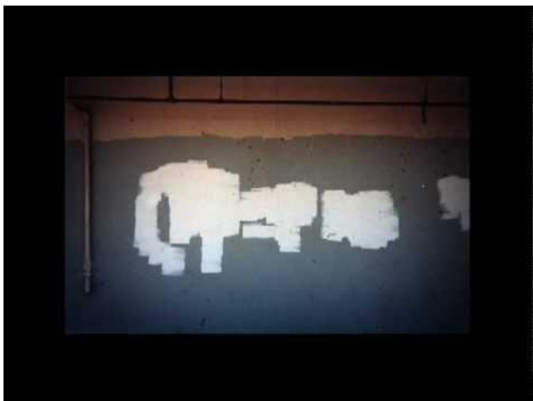
Slika 3. Matt McCormick, Podsvjesna umjetnost uklanjanja grafita , (eng: Subconscious art of graffiti removal ) 2001.