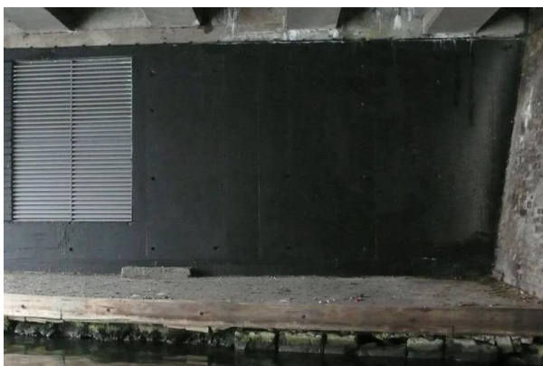
Slika 11. Autor nepoznat, Bez naziva , 2010.