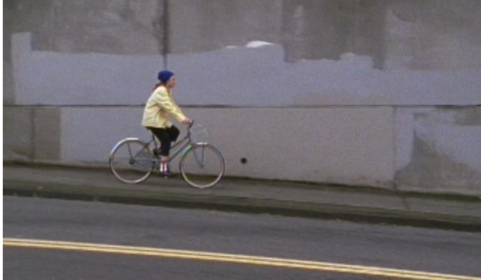
Slika 1. Matt McCormick, Podsvjesna umjetnost uklanjanja grafita , (eng: Subconscious art of graffiti removal ) 2001.