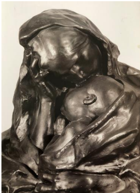
Slika 10. Majčina briga skulptura