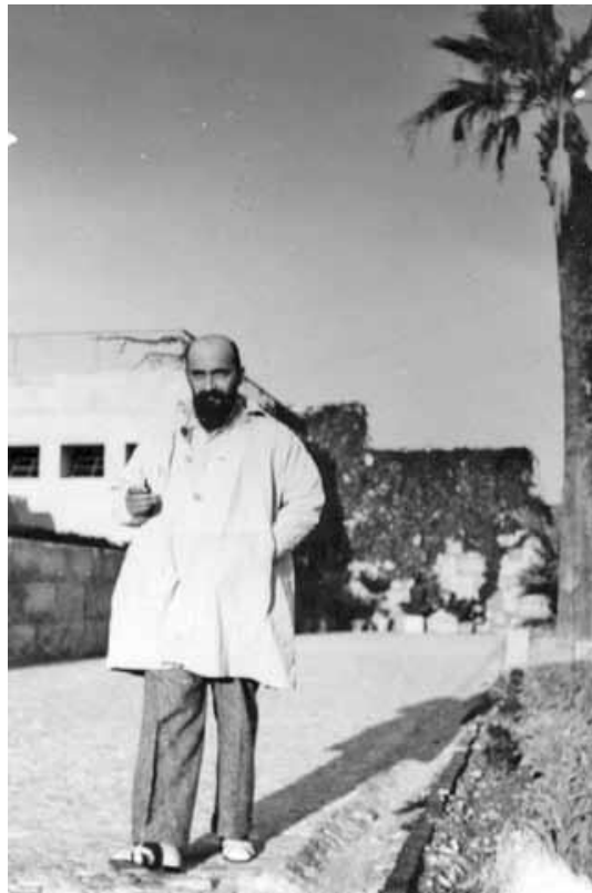
Slika 1. Ivan Meštrović