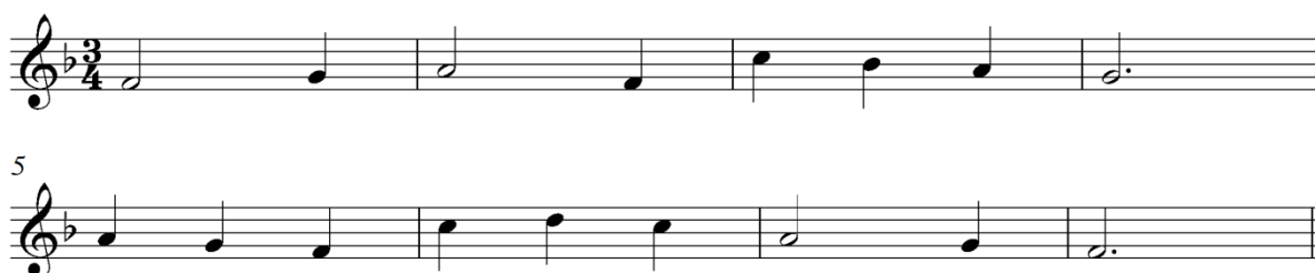
Slika 4: Primjer igre ritmiziranja (Lazarin 1992, sv. 2; 136)

Sljedeću aktivnost glazbenoga stvaralaštva autor naziva melodijska slagalica . Melodijska slagalica fokusira se na izvježbavanje učenikova oblikovanja melodije prema zadanoj harmonijskoj, tj. akordičkoj osnovi (toničkoga, subdominantnoga i dominantnoga kvintakorda) prema zadanoj mjeri i zadanom ritamskom toku. U kontekstu zadanoga tonaliteta označen je početni ton, završni ton prve glazbene rečenice ili početni ton druge glazbene rečenice te je označen zadnji ton cijele melodije (Slika 5).