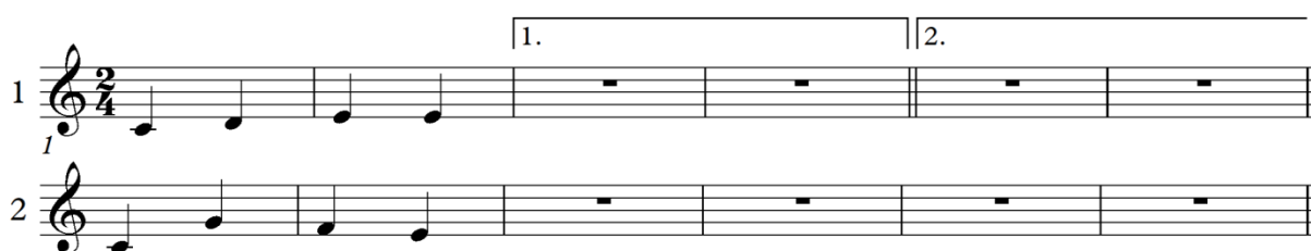
Slika 1: Primjeri zadataka glazbenoga stvaralaštva za učenike prvoga razreda solfeggia (Golčić 2003, 127)

U malom, tek neznatnom dijelu, pojedini udžbenici i priručnici za učitelje iz nastave solfeggia govore o potrebi za provođenjem glazbenoga stvaralaštva u nastavi toga predmeta. Ivan Golčić ističe da sposobnost dječjega maštanja u glazbi treba njegovati, poticati te estetski usmjeravati. Iako smatra da djecu treba što više uključivati u improvizaciju te ih poticati da se njome bave, u udžbenicima nema dovoljno primjera koji bi potkrijepili njegove stavove o važnosti i potrebi provođenja stvaralaštva. Navodi da se improvizacija u nastavi solfeggia može vježbati na način da se prvo izdvoji motiv kao pitanje te nakon toga učenik treba dovršiti zadanu frazu u obliku odgovora. Također, navodi se da bi se izvođenje završetka započete zadane vokalize na notnom modulatoru trebalo prepustiti učenicima (Golčić 2003, 4-5). U priručnicima za učitelje prvih i drugih razreda solfeggia stvaralačke aktivnosti u prvom razredu ne provode se na satima, već se predlaže da učenici za domaću zadaću dovršavaju započete melodije koje se nalaze u udžbeniku (Slika 1).