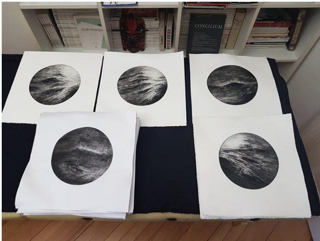
Slika 2: primjeri monotipija

određen i statičan lik, čvrsto fiksira motiv i suprotstavlja se njegovom karakteru temeljenom na ideji da ništa nije statično, da se sve kreće. Kružnica, kao pravilna, obuhvatna linija kruga, počinje i završava kretanjem točke u svom početku, ujedno kraju, što si konceptualno predstavljam kao circulus vitiosus 6 ili začarani krug. Zbog lakše vizualne percepcije konačnog izgleda rada pred samom intervencijom rezanja matrica na konačni okrugli oblik izradio sam nekoliko monotipija na identičnoj veličini (na slici 2 nalazi se prikaz otisaka monotipija).