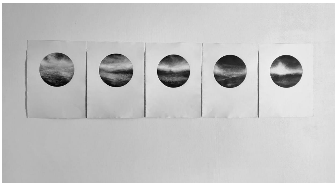
Slika 6: prikaz konačne izvedbe rada

Matrice kao nositelji vizualnog zapisa konačno su pripremljene za zadnji čin na putu do konačnog ostvarenja. Postupci pripreme, čišćenja, nabojavanja i otiskivanja isti su kao u prethodnim fazama. Konačni rad otisnut je na 300 gramskom grafičkom papiru proizvođača Hahnemuhle. Vizualni identitet rada konačno dobiva svoju realnu sliku (na slici 6 nalazi se prikaz konačnog rada ) u apsolutnoj sintezi subjekta i objekta, naravi i duha.