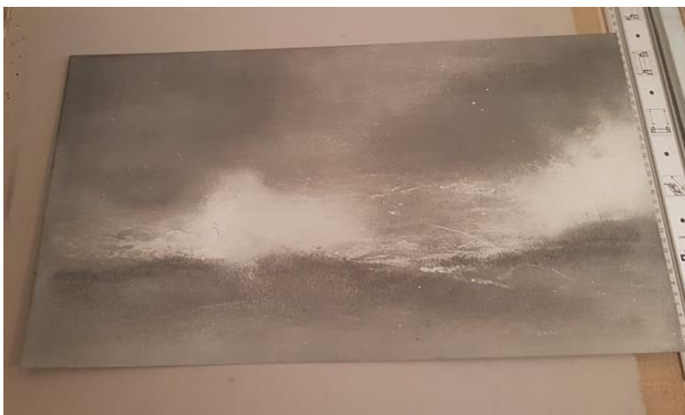
Slika 3: prikaz matrice pravokutnog oblika dimenzije 30x60 cm

Evidentiranje trenutka putem grafičkog zapisa u sekvencama, kontradiktorno je tradicionalnoj reproduktivnoj funkciji grafike. Meni je namjera evidentirati trenutke, u teorijskoj mogućnosti prema beskrajnom nizu, a ne umnožavati konačni grafički zapis. “Cilj originalne grafike i nije umnožavanje crteža odnosno grafičke slike, nego je jedno od mnogobrojnih umjetničkih samostalnih sredstava izražavanja” 8 . U rasponu izražajnih mogućnosti grafike potrebno je bilo odabrati odgovarajuću tehniku koja nudi specifičnu izražajnost. Želju da u grafičkom radu zadržim što više likovnih elemenata crteža postupkom oblikovanja višetonske slike realizirao sam u tehnici akvatinte 9 .