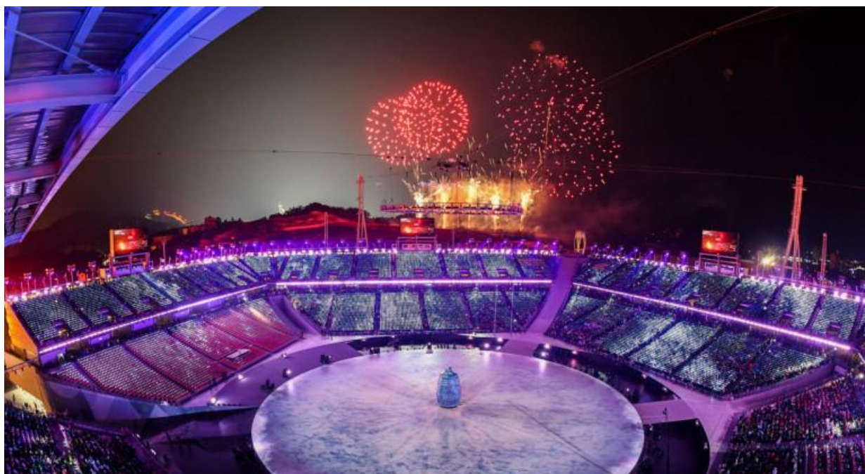
Slika 1. Olimpijske igre- prikaz spektakla i njegovih karakteristika

Medijski sadržaj je predstavljen kao šou te fantazija i svim gledateljima se nudi sadržaj individualno. Natjecateljski dio spektakla ne postoji jer je medijski prostor zauzeo megaspektakl- to jest ključni događaj svoga doba.