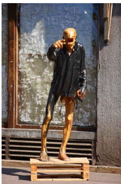
Slika 8. Stjepan Gračan, Bez naziva XL , 1981., poliester