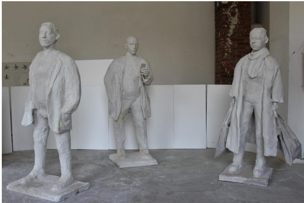
Slika 14. Završen rad