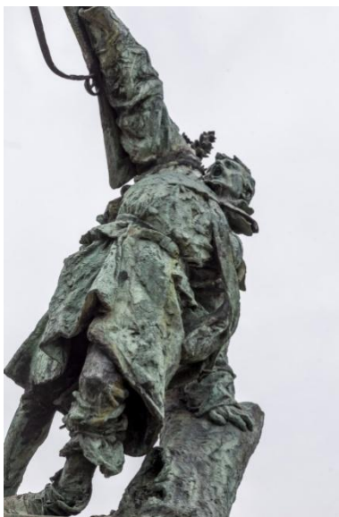
Slika 7. Robert Frangeš Mihanović, Umirući vojnik , 1897., bronca

Još se jedan vrlo značajan domaći kipar koristi anatomskim izobličenjima radi dojma dramatičnosti i groteske, a to je suvremeni umjetnik Stjepan Gračan čije provokativne figure inspiriraju mlade hrvatske kipare.