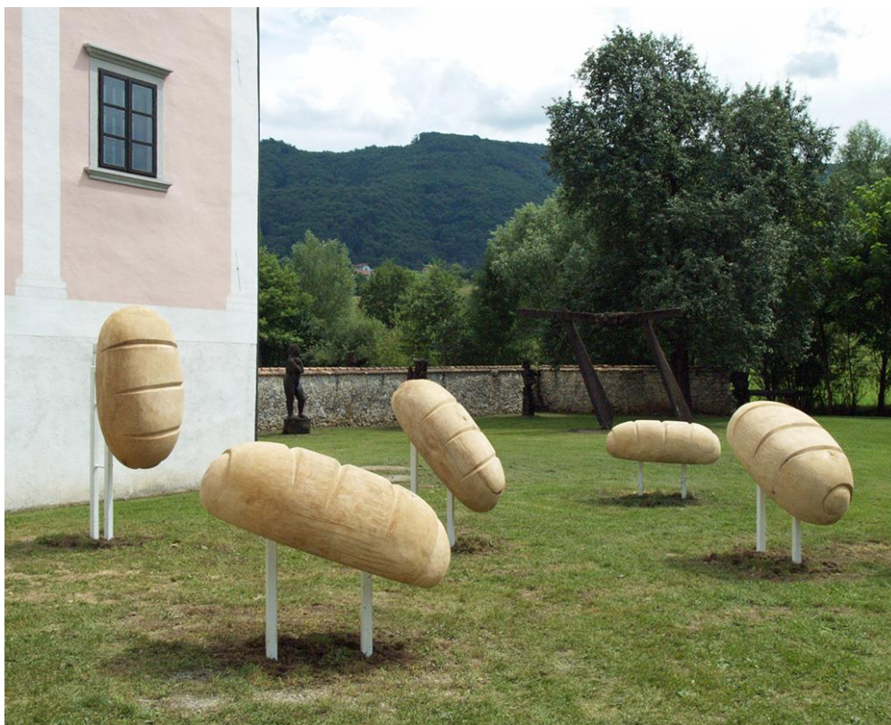
Denis Kraškovič: „Dobrota“ 2012., Kostanjevica, Slovenija

Denis Kraškovič (23.ožujak 1972.) hrvatski je suvremeni kipar koji je diplomirao na Akademiji likovnih umjetnosti u Zagrebu 1994. Poznat je po svojim predimenzioniranim skulpturama gdje vrsno pokazuje poznavanje kiparskog zanata. Što još možemo isčitati u njegovoj umjetnosti jest ljubav prema prirodi te sklad s njom samom. Izrađuje skulpture životinja, također slike i crteže. Prvi značajni radovi bili su skulpture pingvina, krokodila i tuljana te naravno kit koji se nalazi u Zagrebu ispred Aquarius kluba u Zagrebu. Sam umjetnik kaže da gleda na pozitivne aspekte života te to želi primijeniti na svoju umjetnost, također i dozu humora. Njegove skulpture su veoma jednostavne forme, a crteži su plošni. Od primjera navela bih njegovu javnu skulpturu imenom „Dobrota“ koja se nalazi u Sloveniji, te javnu skulpturu kita u Zagrebu.