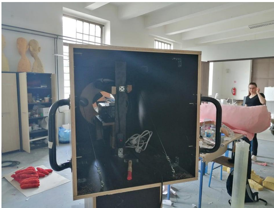
Slika 4. Unutrašnjost izvana s ručkama, Ivan Kopp, drvo, željezo