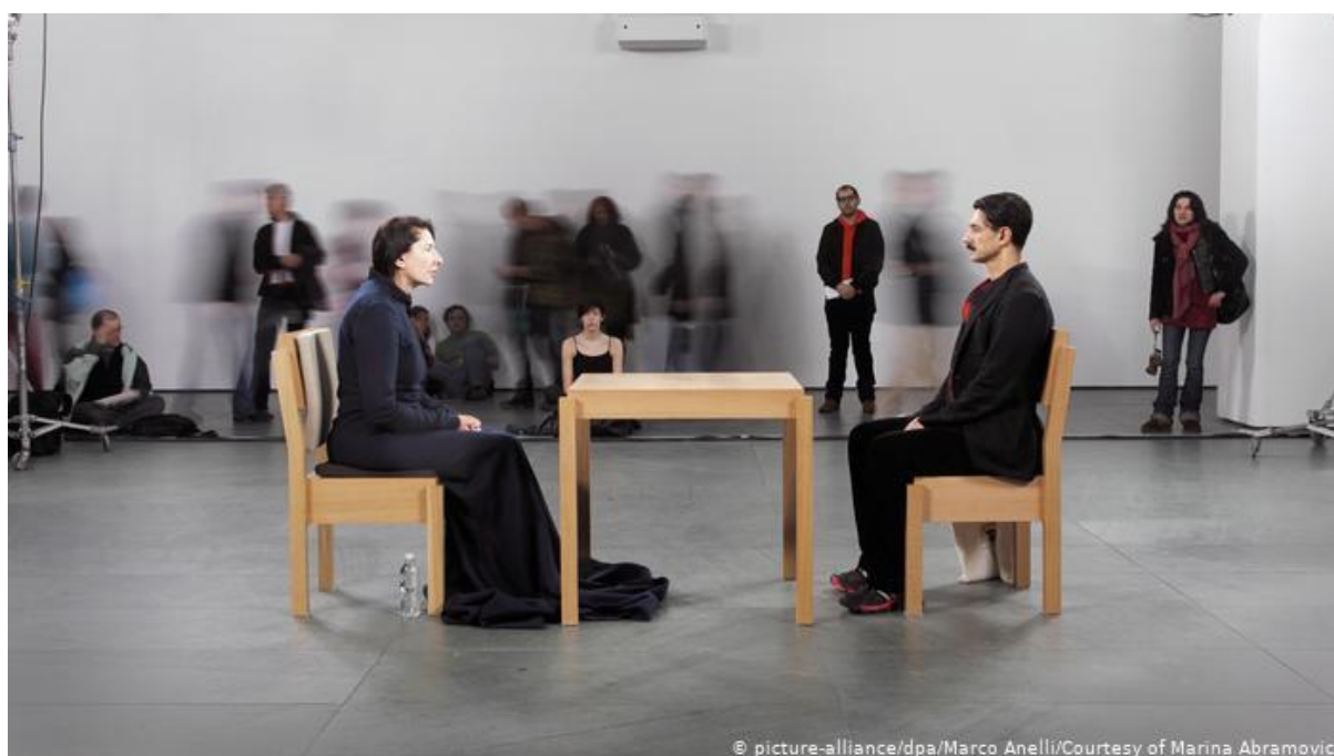
Slika 11. Marina Abramović, performans „Čistač“