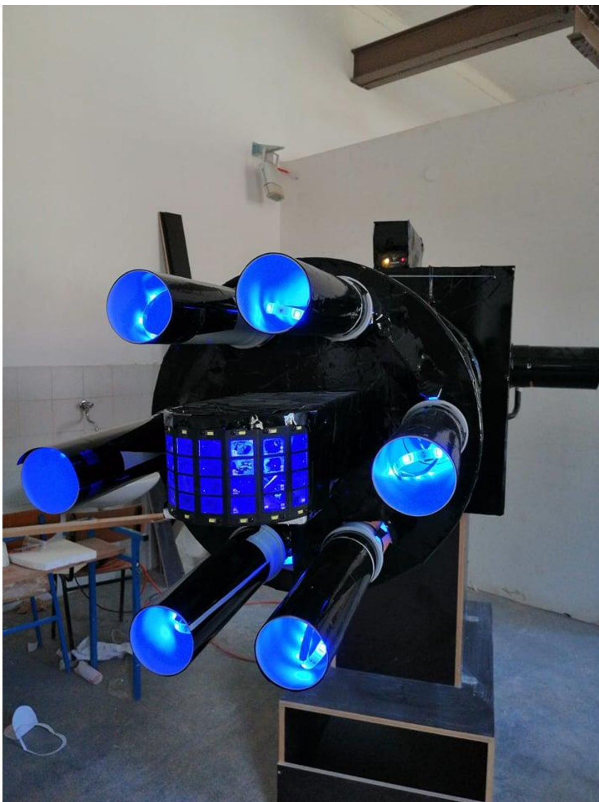
Slika 8. Plavi pogled sprijeda na rad „Ex machina“, Ivan Kopp