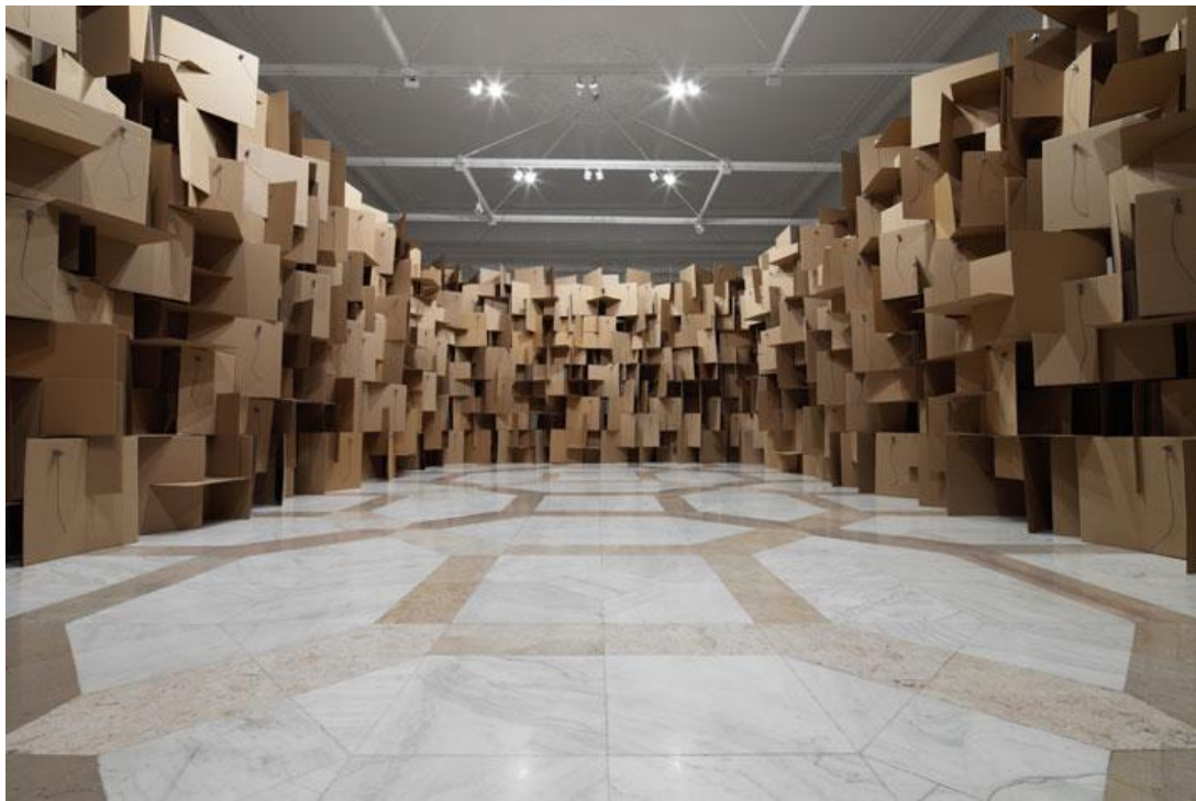
Slika 12. Zimoun, prostorno - zvučna instalacija 1