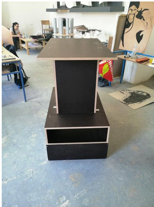
Slika 1. Skelet „Ex machine“, Ivan Kopp, drvo