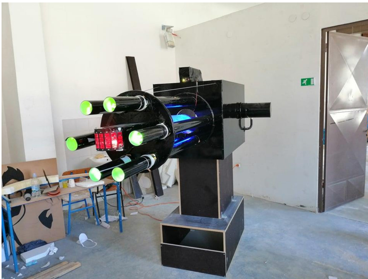
Slika 6. „Ex machina“ u završnoj fazi, Ivan Kopp