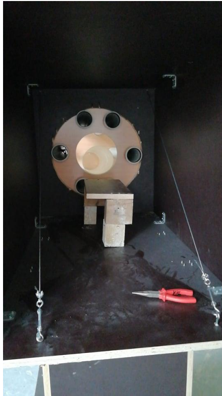
Slika 3. Unutrašnjost „Ex machine“, Ivan Kopp, drvo, lajsne