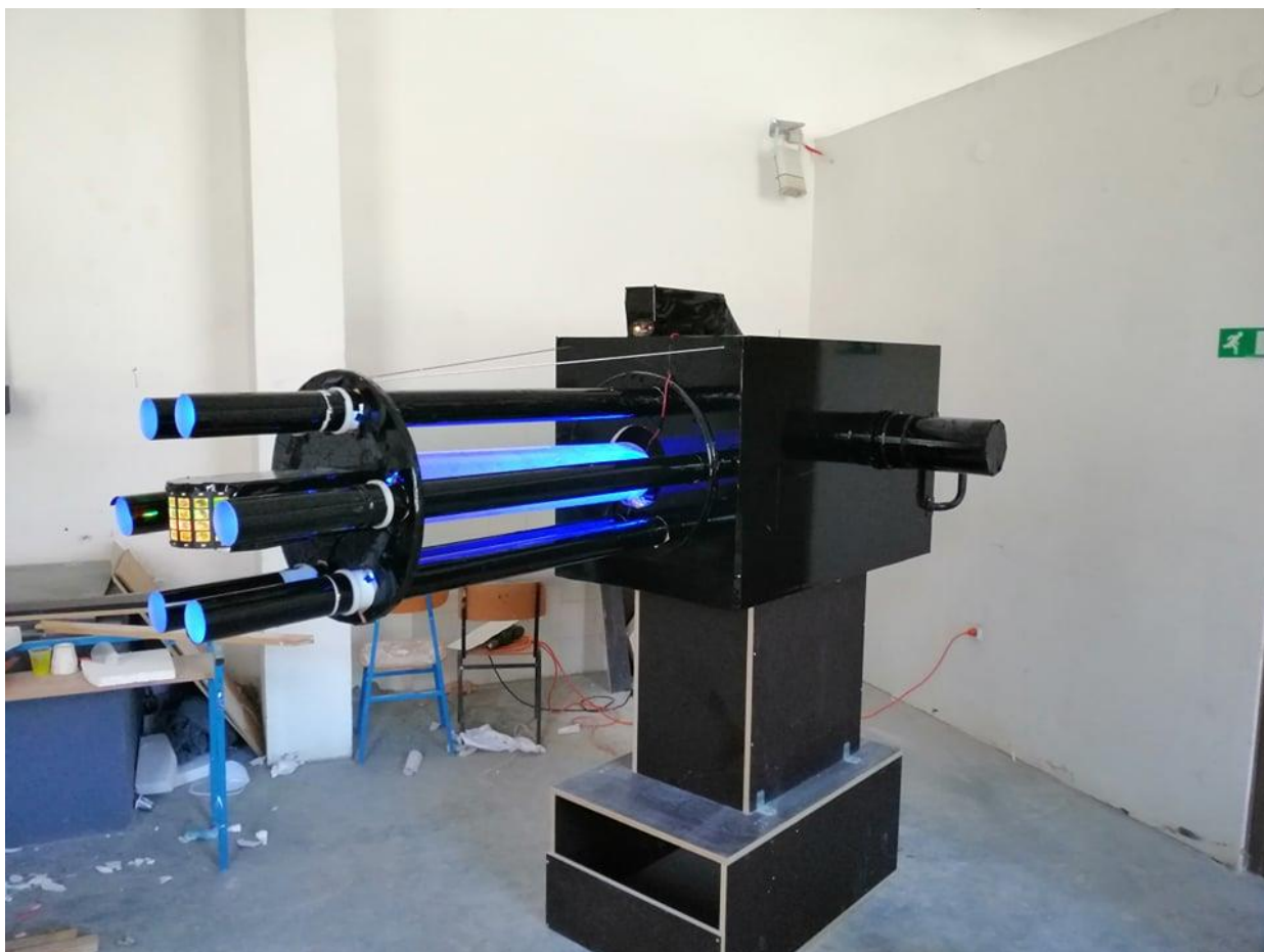
Slika 9. Bočni pogled na rad „Ex machina“, Ivan Kopp