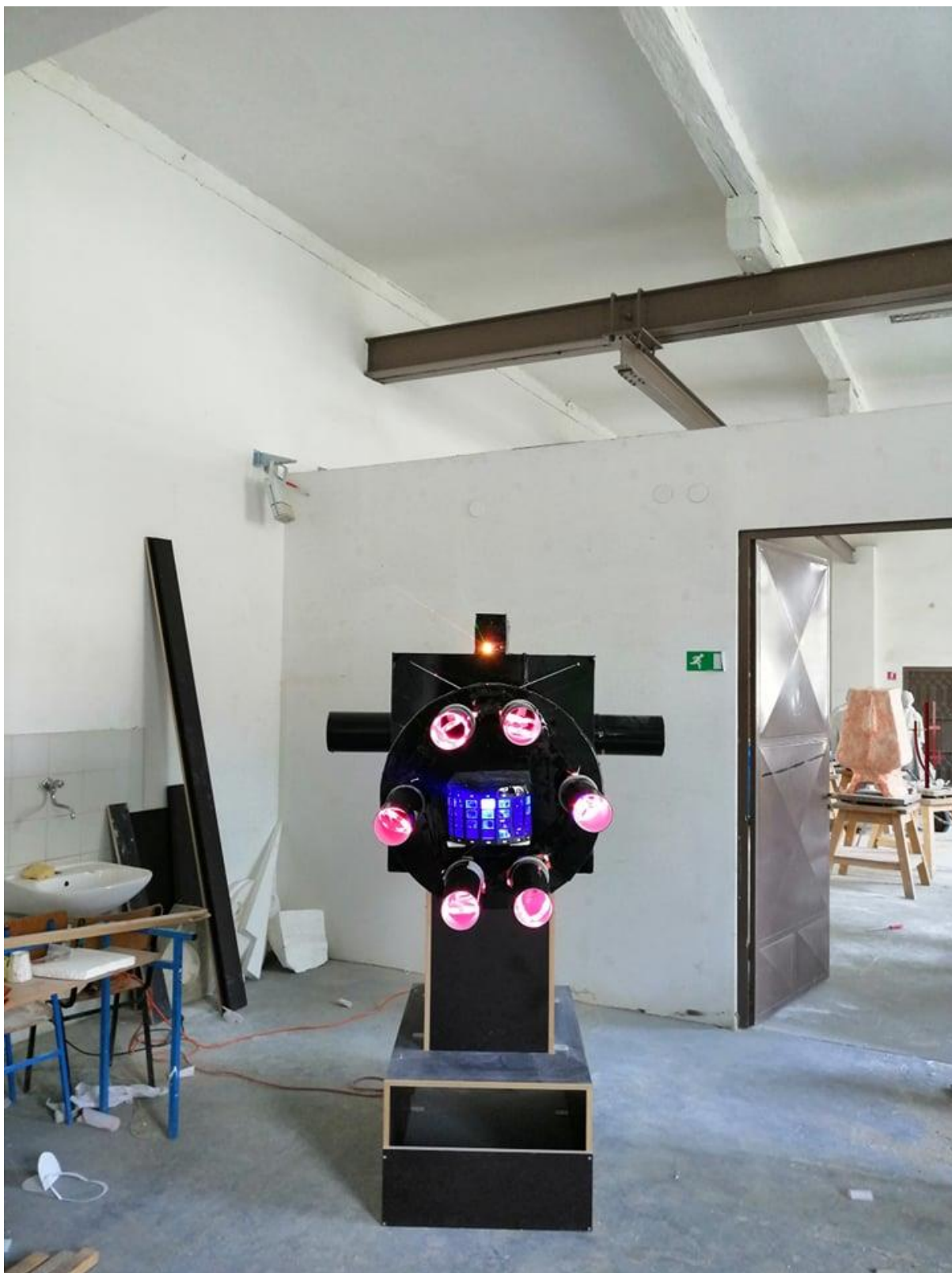
Slika 7. Pogled srijeda na rad „Ex machina“, Ivan Kopp