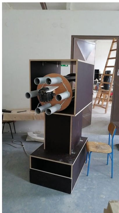
Slika 2. Skelet i top, Ivan Kopp, drvo, plastika, led svjetla, disko kugla