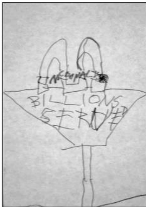
Slika 1. Crtež zgrade McDonald's-a (Emery, 2004.)

Emery (2004.) je u svom radu prikazala i napredak kod spomenutog dječaka u pogledu ponosa zbog svog postignuća koje je uspjela dobiti kod djeteta, a što je vrlo važno u socijalnom učenju odnosa. Nakon što je dječak nacrtao zgradu McDonald's-a, s jasno izraženim znakom i detaljno označenim linijama krova (Slika 1), terapeutkinja ga je upitala kako bi mogao doći do McDonald's-a kako bi jeo omiljenu hranu. Odgovorio je automobilom te da bi ga odvezla majka. Terapeutkinja ga je zamolila da nacrtaj automobil koji ide prema restoranu. Prvo je zabrinuto tražio igračku automobila kako bi ga mogao pogledati i nacrtati, no terapeutkinja ga je ohrabrila da nacrtaj svoj automobil i kako je sigurna da bi bio predivan. Dječak je nacrtao automobil (Slika 2) i majku s rukama na volanu te sebe na stražnjem sjedalu.