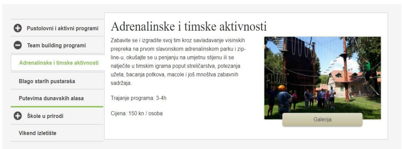
Slika 3: Adrenalinski park- Zlatna greda