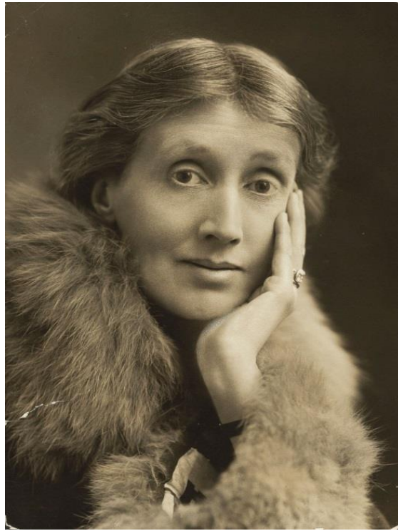
Slika 1. Virginia Woolf (1927.)

Adeline Virginia Stephen rođena je 25. siječnja 1882. godine kao šesto od osmero djece. Godine djetinjstva provodi u velikoj viktorijanskoj obitelji u londonskoj ulici Hyde Park Gate. U to vrijeme, školovanje djece nije bilo obavezno, stoga otac i ugledni intelektualac Leslie Stephen svoje dvije kćeri Virginiju i Vanessu školuje kod kuće. Time su sestre Stephen stekle veliko, ali neformalno obrazovanje te vrlo rano znale čime će se baviti ostatak života.