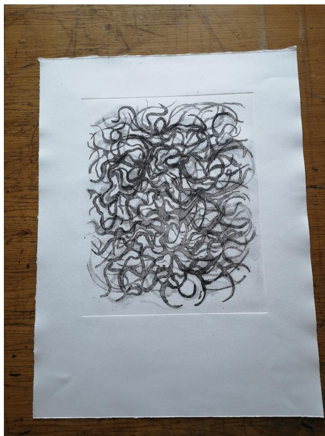
Slika 3, reservage, 2020.