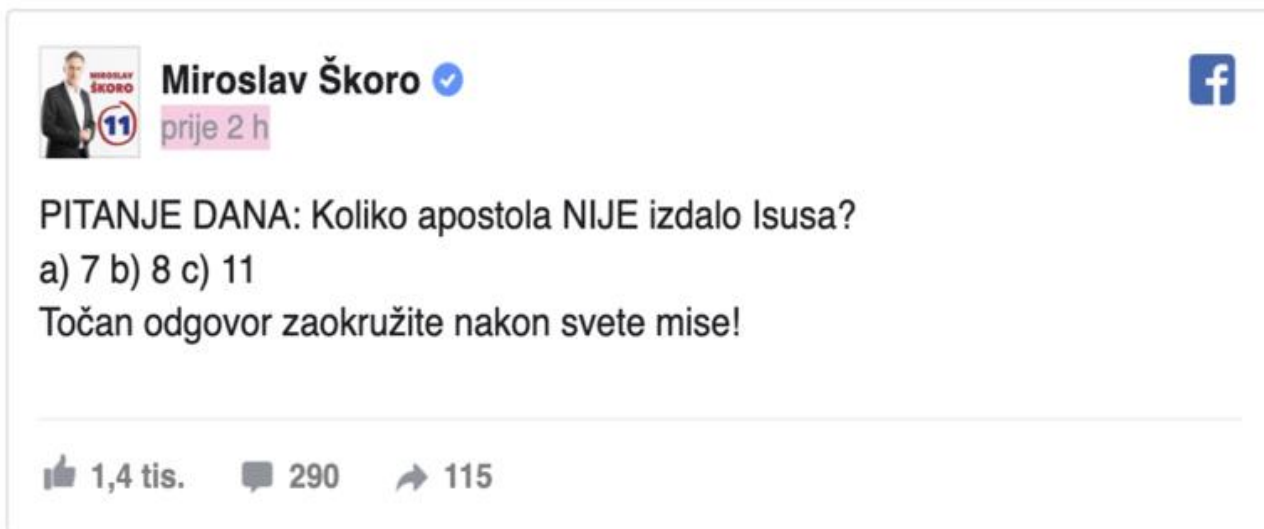
Slika 3 Miroslav Škoro prekršio predizbornu šutnju

U svojoj Facebook kampanji Miroslav Škoro je koristio i nekoliko zabavnih video skečeva na temelju svoje uloge iz emisije Večernja Školagdje je Željko Pervan na duhovit način komentirao njegovo gostovanje u emisijama Bujica i Nedjeljom u 2. S vremenom je broj pratitelja njegove službene stranice sve više rastao, a prava ekspanzija broja pratitelja dogodila se nakon predsjedničkog skupa u K. D. Vatroslava Lisinskog. Navedeni predsjednički skup nije služio samo kao događaj u kojem on govori i obraća se svojim potencijalnim biračima, nego i kao odlična prilika za prikupljanje materijala za objave na društvenim mrežama što potvrđuje činjenica da je nakon skupa započela promjena orijentiranosti na mlade ljude u Zagrebu od 18 do 30 godina, dok je do tada fokus bio usmjeren na Slavoniju i njezino stanovništvo starije od 40 godina. Miroslav Škoro često se služio live stream video prijenosima u kojima je komunicirao sa svojim narodom i odgovarao na njihova pitanja. Također, svi veći predizborni skupovi, uključujući i onaj u Lisinskom, bili su preneseni uživo putem Facebook video streama.