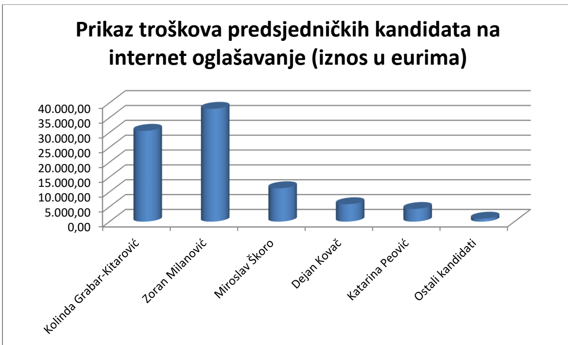
Grafikon 2 Budžet predsjedničkih kandidata na internet kampanju (Samostalni rad autora)

Iz prethodno navedenog grafikona jasno se može vidjeti koliko su predsjednički kandidati u prvom krugu izbora za predsjednika Republike Hrvatske uložili novaca u suvremeno internet oglašavanje. Prema velikoj analizi digitalne kampanje predsjedničkih kandidata koja je provedena 21.12.2019. godine možemo zaključiti kako je većina predsjedničkih kandidata imala dobar budžet za provedbu online kampanje. U digitalnu kampanju najviše je uložio Zoran Milanović s potrošenih 37.992,00 eura, nakon njega slijedi Kolinda Grabar-Kitarović koja je potrošila 30.582,00 eura, Miroslav Škoro uložio je 11.247,00 eura, Dejan kovač uložio je 5.860,00 eura. a Katarina Peović 4.279,00 eura dok su ostali predsjednički kandidati uložili 1.000,00 eura ili manje od toga. Izvor navedenih podataka su Facebook galerija oglasa i Google izvješće o transparentnosti. zanimljivo je kako predsjednički kandidat Dario Juričan nije uložio mnogo sredstava u bilo koji oblik oglašavanja, ali je od informativnog portala Index.hr dobio medijski prostor u vrijednosti 200.000,00 kuna potpuno besplatno.