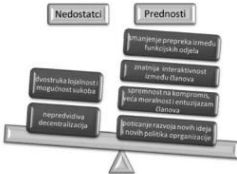
Slika 2 Prednosti i nedostaci timske organizacije