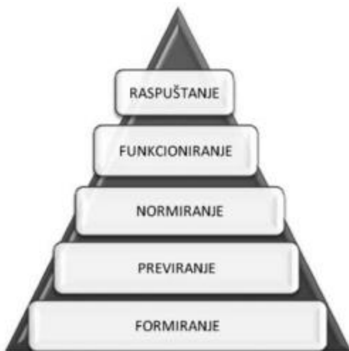
Slika 1 Faze razvoja tima

Sve veći broj modernih menadžera koristi timove za ostvarivanje organizacijskih ciljeva. No, samo osnivanje tima ne jamči da će davati rezultate. „Menadžeri bi, zapravo, trebali biti strpljivi ako osnovani tim ne daje na samome početku očekivane rezultate, jer timovi obično moraju proći kroz nekoliko razvojnih faza prije nego postanu proizvodnima.“ (Tudor, Srića, 2006: 73). Menadžer mora razumjeti taj razvojni proces kako bi ga mogao olakšati. U nastavku rada bit će analizirane različite faze kroz koje tim obično mora proći prije nego što ostvari svoj puni potencijal.